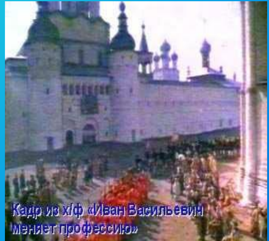
Кадр из х/ф «Иван Васильевич меняет профессию»