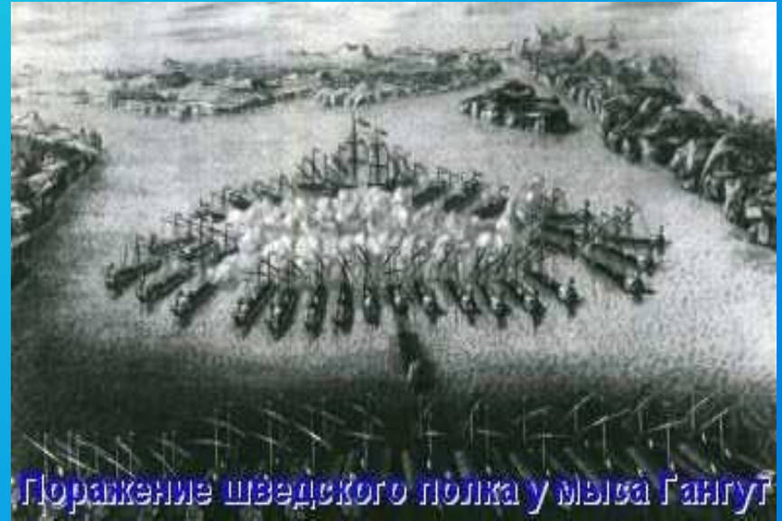
Поражение шведского полка у мыса Гангут