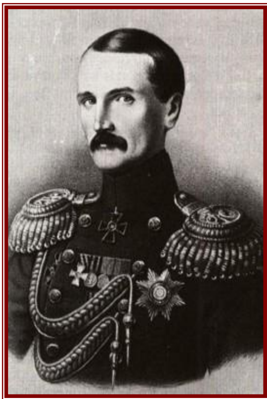
Корнилов Владимир Алексеевич (1806–1854)