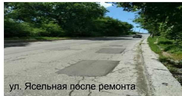
ул. Ясельная после ремонта