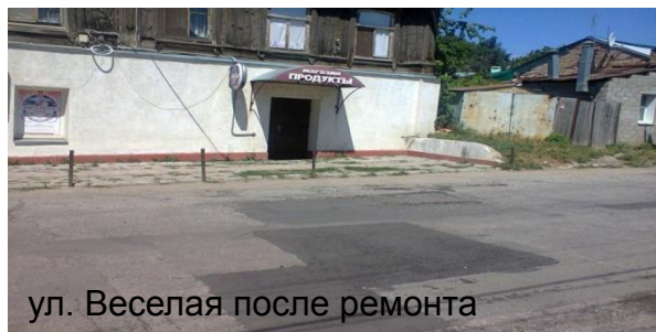
ул. Веселая после ремонта