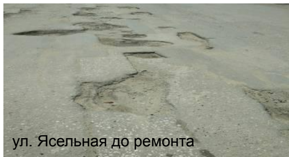
ул. Ясельная до ремонта

В I полугодии 2016 г. проведены следующие основные работы: - текущий ремонт покрытия проезжей части улиц с общей площадью устраненных дефектов 93 тыс. кв. м, в том числе 30,5 тыс. кв. м. с применением при низких температурах литой асфальтобетонной смеси и 3,5 тыс. кв. м струйно-инъекционным методом; - текущий ремонт тротуаров 2,8 тыс. кв. м.