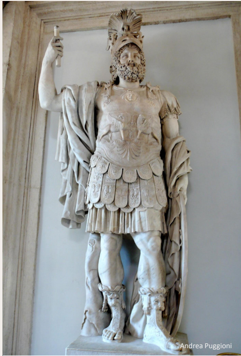
Царь Эпира Пирр 318–272 гг. до н.э.

Царь Эпира Пирр оказал сопротивление римским войскам. Он мечтал померяться силой с римской армией и такой случай ему представился.