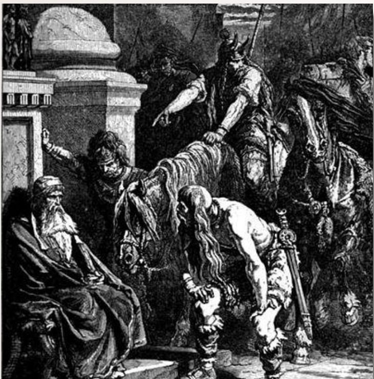
Галлы в Риме

Воинственные племена галлов с территории современной Франции вторглись в Рим, разбили римское войско и ограбили город. Остатки войска и сенат укрылись на Капитолийском холме.