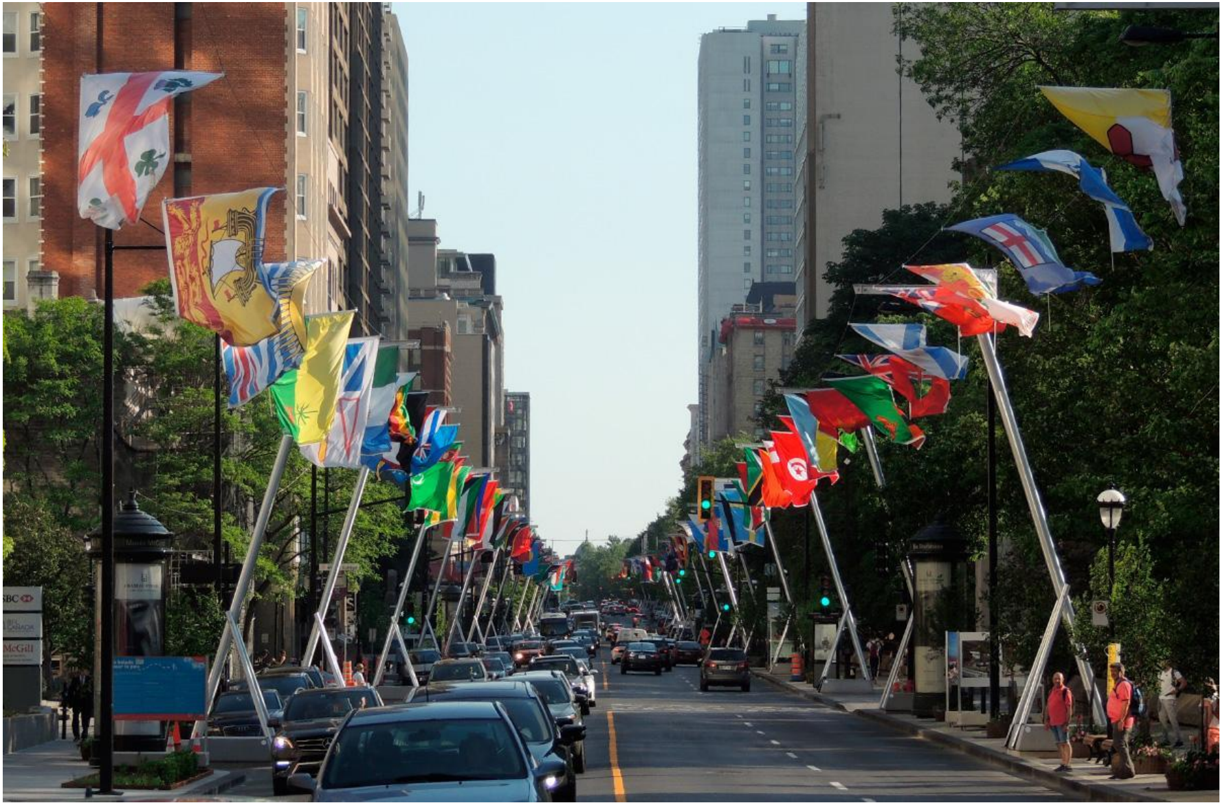
Claude Cormier “Balade pour la Paix”