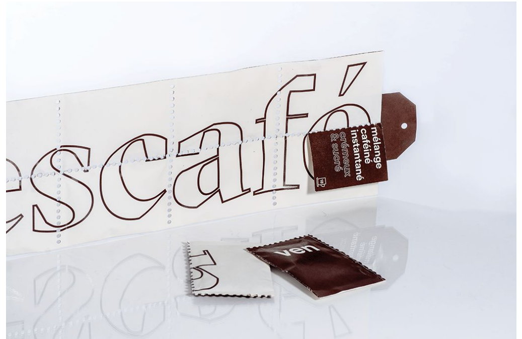
NESCAFÉ by Anne-Soorya Takoordyal & Coralie Grandjean UQAM, Montreal, Canada