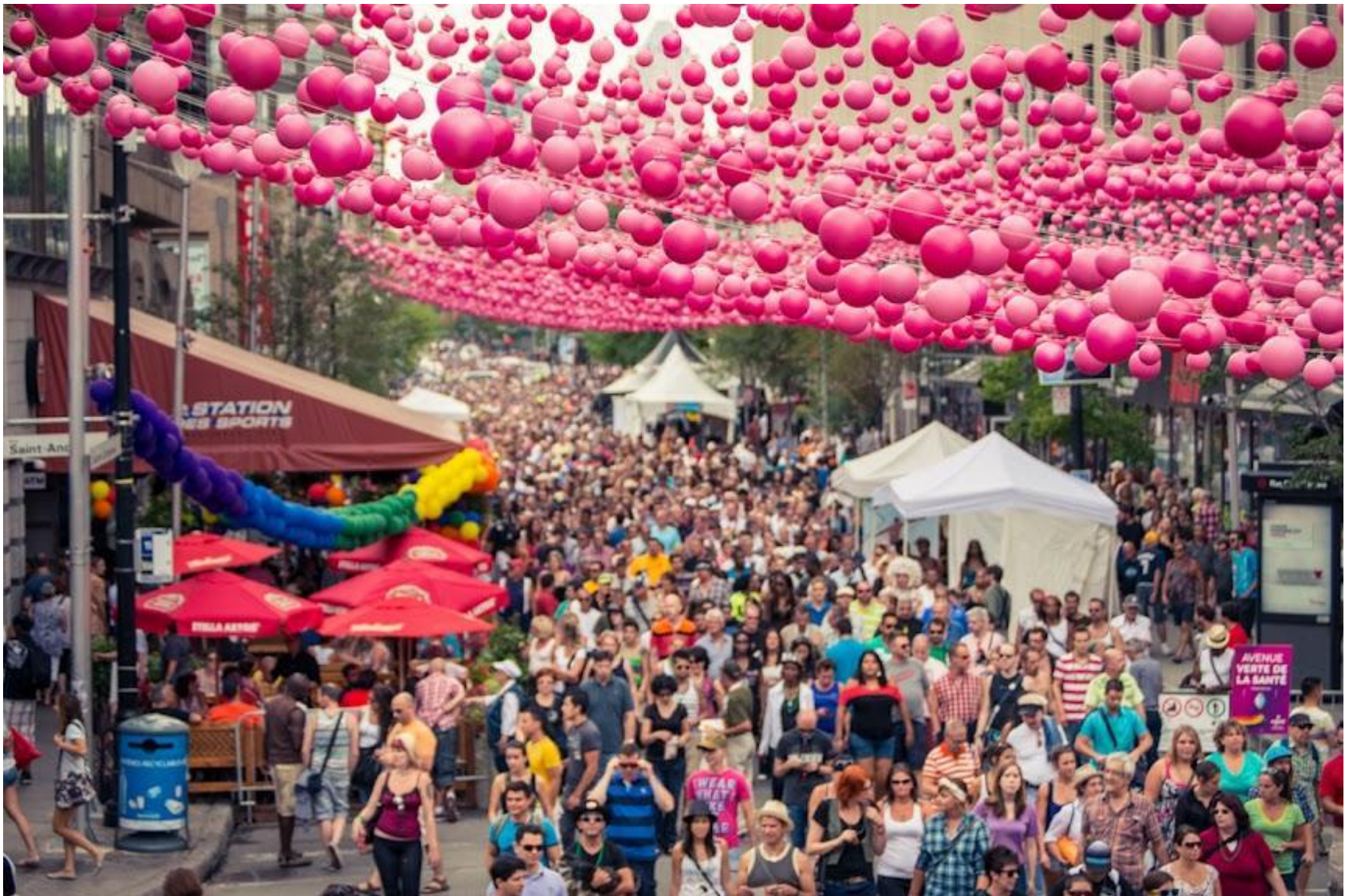
Клод Кормье «Pink balls»