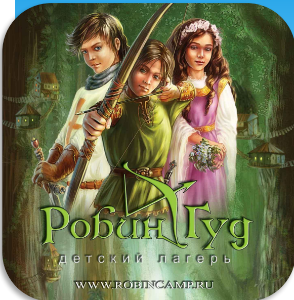
Программа «Робин Гуд» с 2006 года