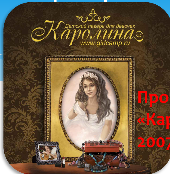
Программа «Каролина» с 2007 года