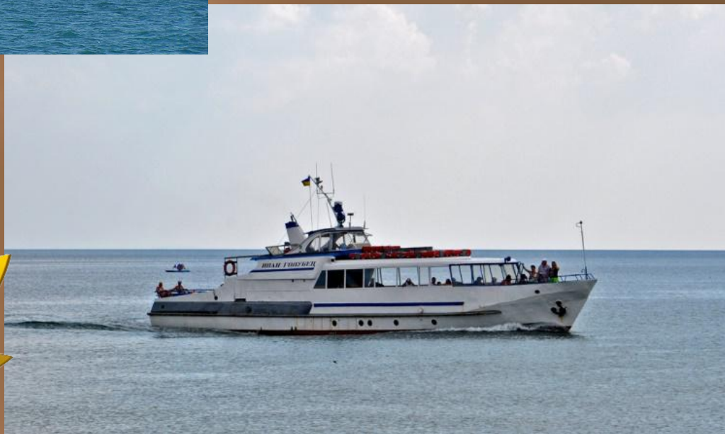
Прогулочный катер « Иван Голубец »