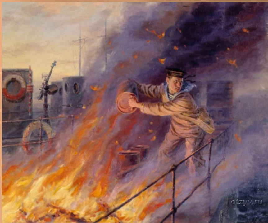
Картина Мальцева П.Т. «Подвиг старшего краснофлотца Ивана Голубца».

Иван Голубец увидел горящий сторожевой катер СК-0121, на борту которого находилось 8 больших и 22 малых глубинных бомбы, возникла угроза мощного взрыва, в результате чего могли быть уничтожены находившиеся поблизости плавучий кран, 4 ремонтирующихся сторожевых катера, болиндер и судоремонтная мастерская. Жертвуя собой, он спас десятки человеческих жизней и боевые катера... Иван Карпович Голубец был с почестями похоронен рядом с местом своей гибели, а после войны на этом месте воздвигли обелиск.