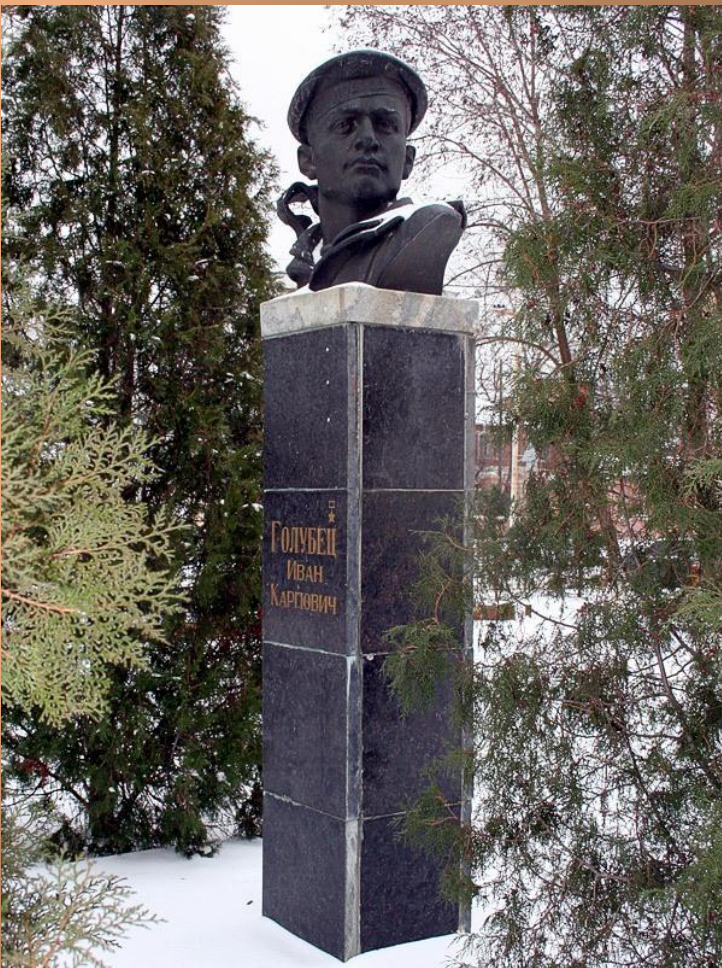
Памятник И. Голубцу в г. Таганроге.