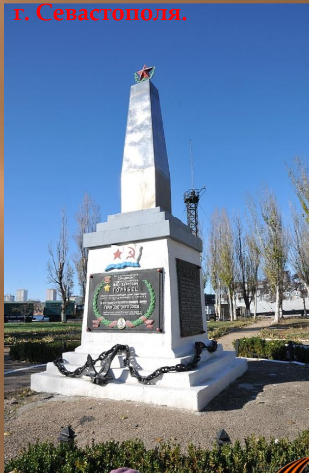
Памятник И. Голубцу в Стрелецкой бухте г. Севастополя.