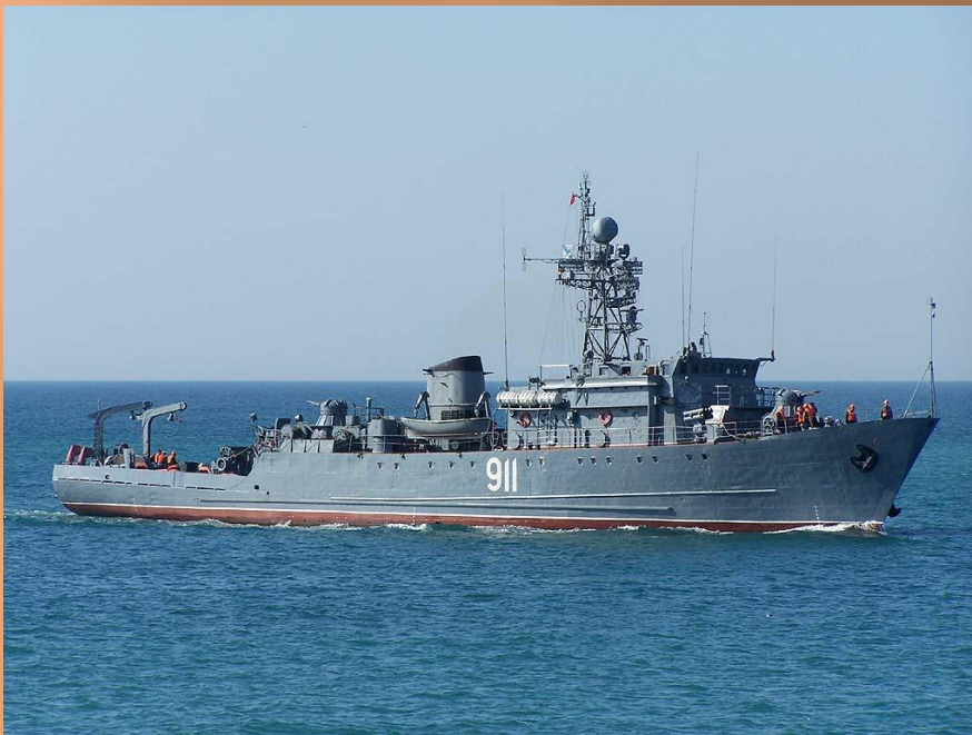
Морской тральщик «Иван Голубец»