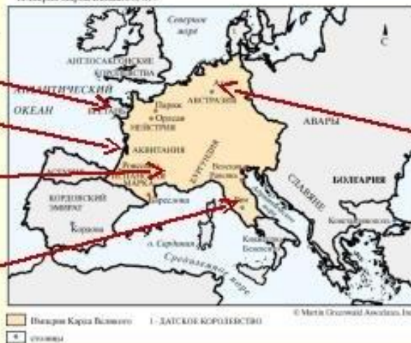
Империя Карла Великого, 814