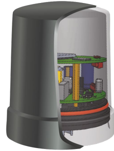
Модуль для дистанционного мониторинга Unilight

Фиксирует нахождение пешехода на переходе