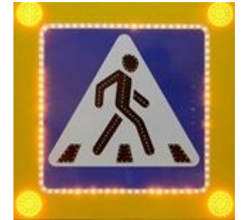
Дорожный знак с подсветкой

Регистрирует команду и подаёт на дорожный знак