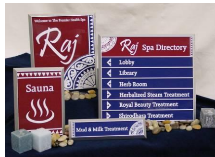
Вывески и указатели