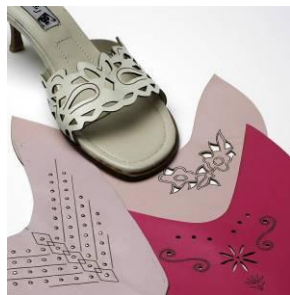
Текстиль и кожа