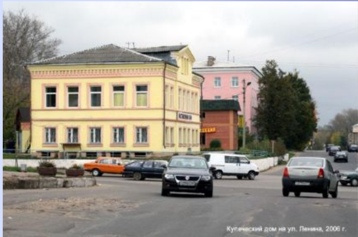
Купеческий дом на ул. Ленина, 2006 г.

Купеческие особняки в уездных и губернских городах были легко узнаваемы, отличимы от особняков дворян и домов мещан. Каменные или деревянные, они выглядели приземисто, даже будучи двухэтажными, как бы оседали под собственной тяжестью. Маленькие окошки при толстых кирпичных или бревенчатых стенах вызывают в памяти крепостные бастионы.