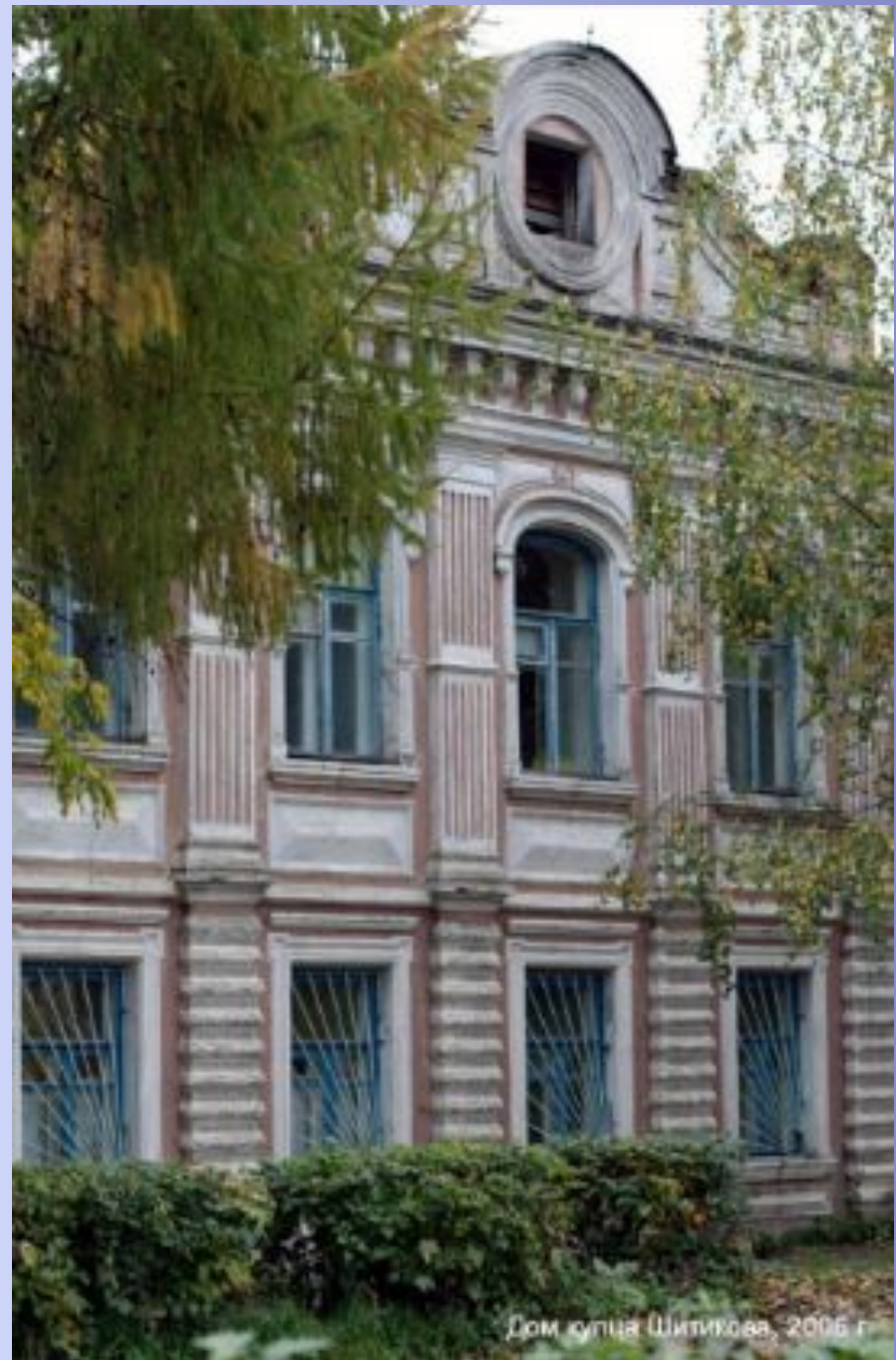
Дом улицы Шитикова, 2006 г.

На первом этаже размещались парадные помещения – большая зала и одна или две гостиные. Они предназначались только для праздничных приемов, как тогда говорили, «для парада». Все остальное время сюда никого, даже домашних, не пускали, чтобы не испортить нарядную мебель. За гостиной следовала большая столовая и кабинет хозяина. Жилые комнаты – спальни и детские – размещались на втором этаже. Они отличались скромными размерами, низкими потолками и маленькими окнами, чтобы дольше хранить тепло от жарко натопленных печей.