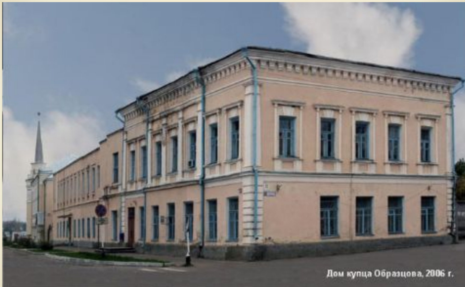
Дом купца Образцова, 2006 г.