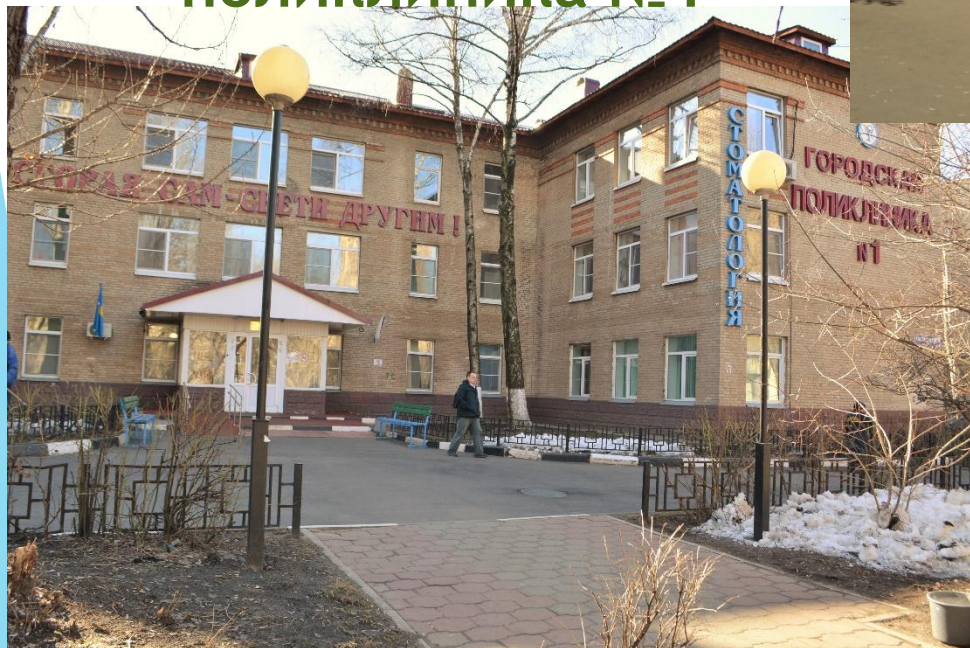
Городская поликлиника №1