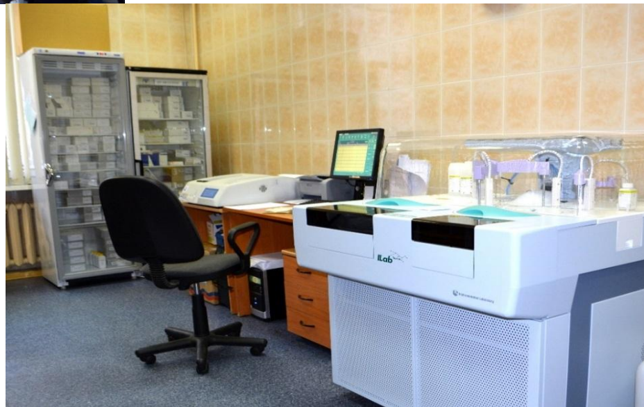
Клинико- диагностический центр