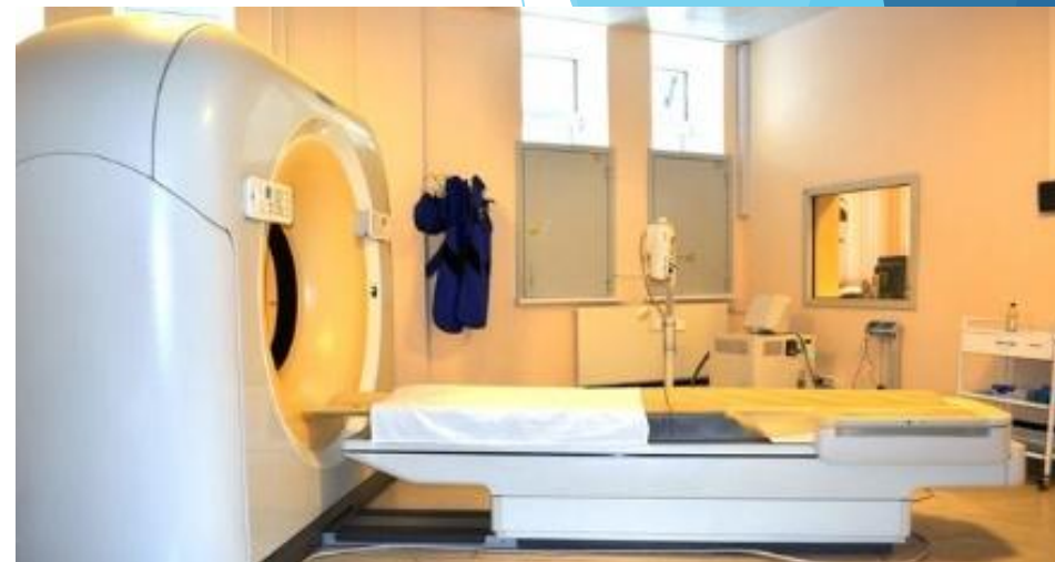
Кабинет рентгеновской компьютерной томографии