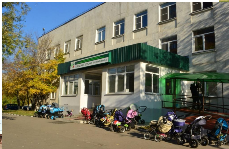
Городская детская поликлиника