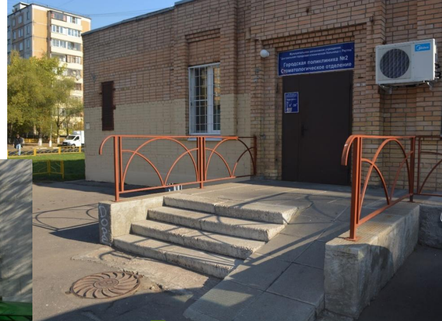
Городская поликлиника №2