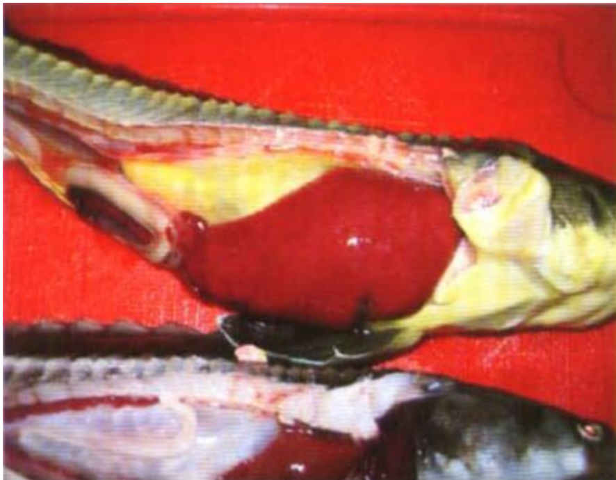
збільшена печінка у російського осетра

Недолік специфічних елементів в кормах риб підвищує їх сприйнятливість до захворювань.