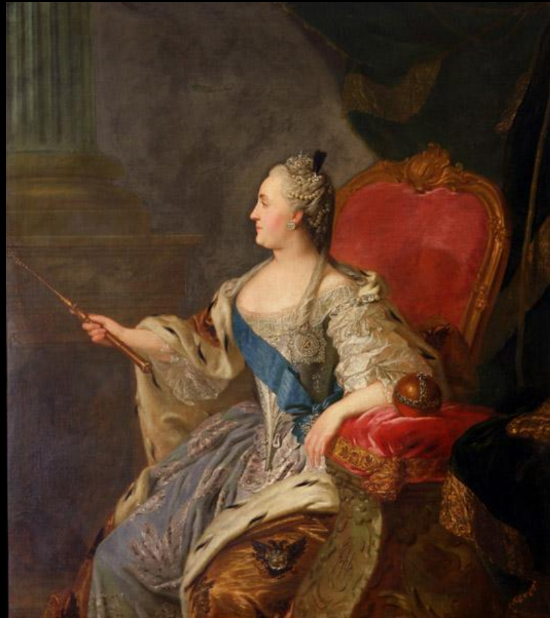
Рокотов. Портрет Екатерины II.