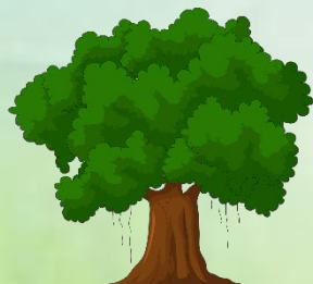
Один могучий дуб