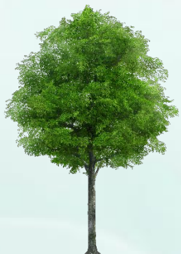
Одно высокое дерево