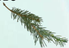
Одна еловая ветка