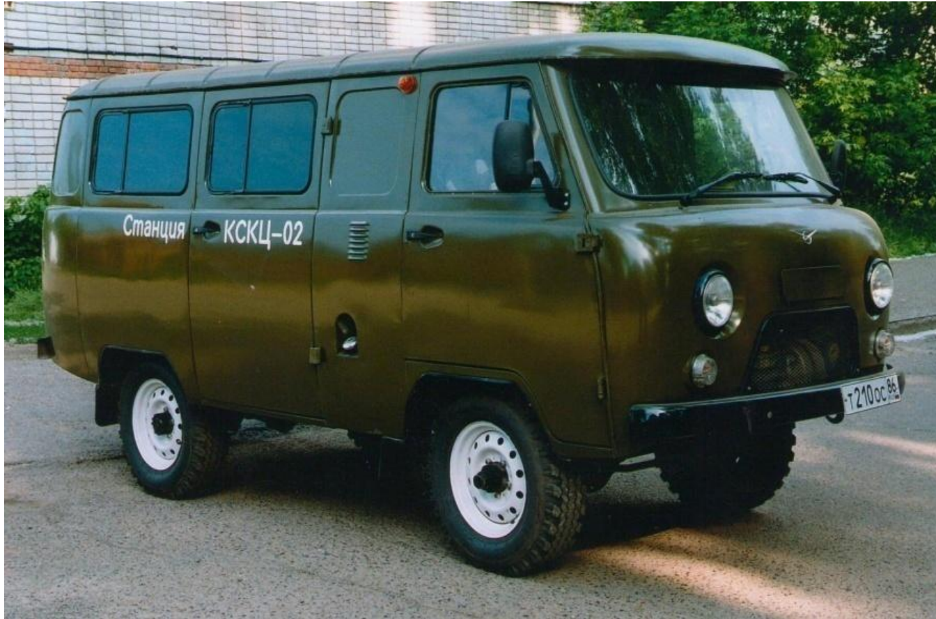
Рис.1. Автомобиль УАЗ-3741, в салоне которого размещается оборудование станции КСКЦ-02