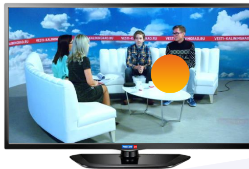
Интеграция (продукт в кадре)