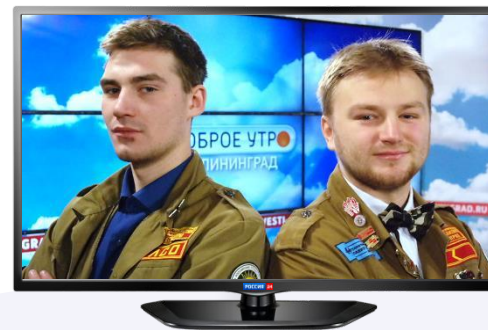
Гость в студии