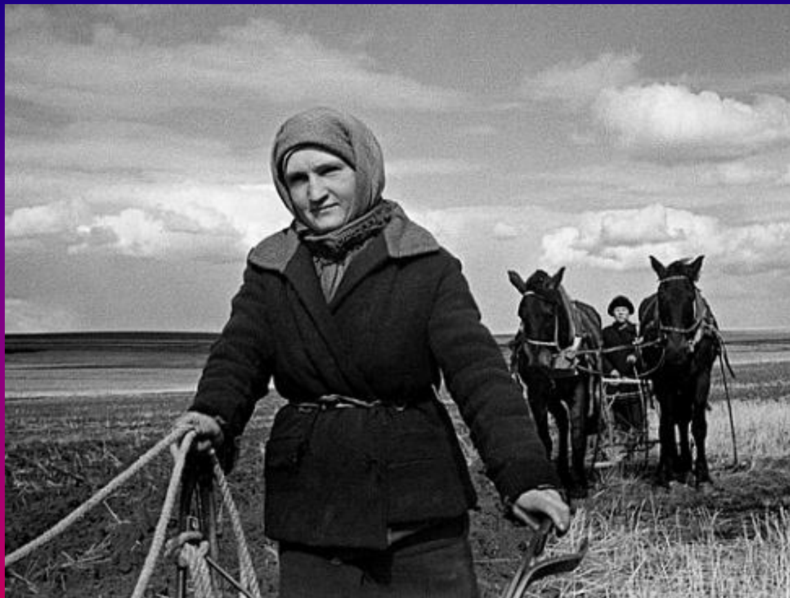
Сельское хозяйство Красноярского края в годы Великой Отечественной войны