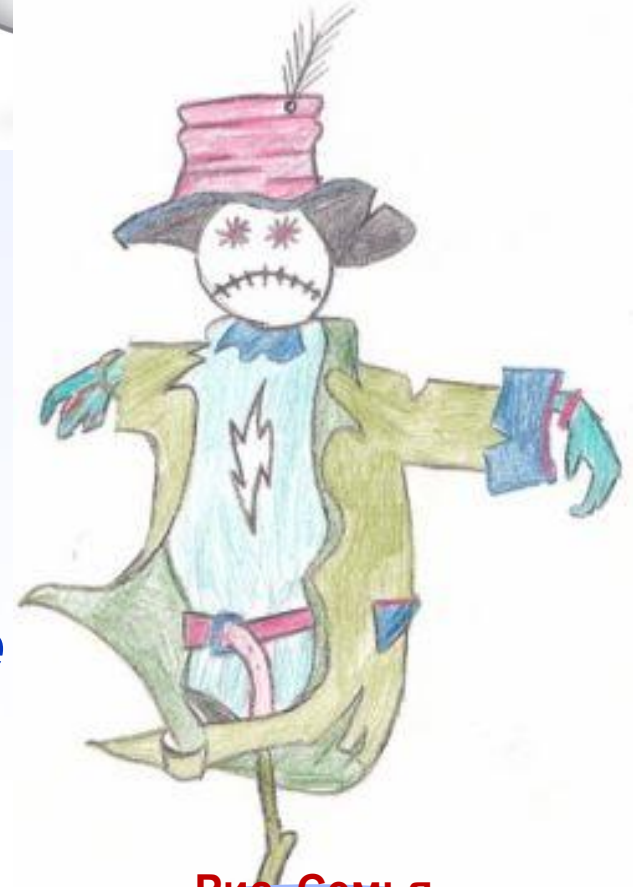
Рис. Семья Смоленцевы х