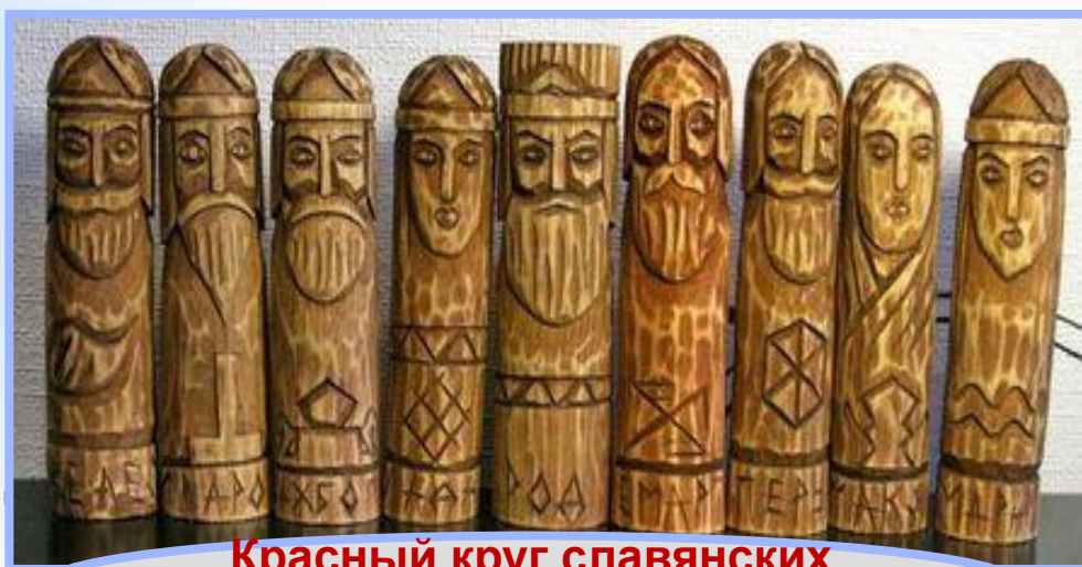
Красный круг славянских богов

Найдя защитников и покровителей, люди почувствовали себя уютнее в огромном и непонятном мире. Они верили им, поклонялись, подносили дары. Так появились первые куклы, облегчившие жизнь наших древних предков.