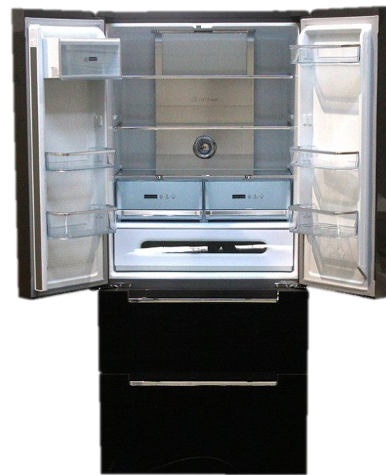
LERAN RMD 557 BG NF