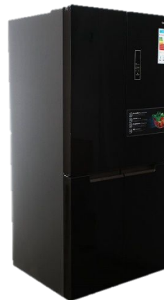
LERAN RMD 557 BG NF