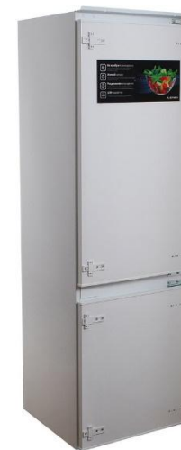
LERAN BIR 2705 NF