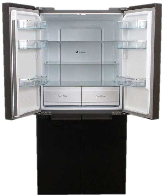
LERAN RFD 773 BG NF