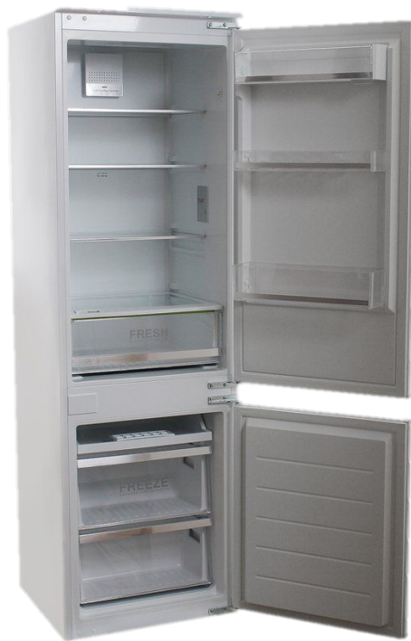
LERAN BIR 2705 NF