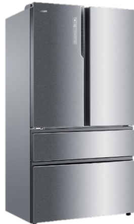
HAIER HTF 456DM6RU