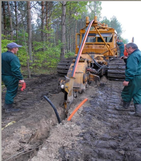
Прокладка труб (кабеля) непосредственно в грунт.