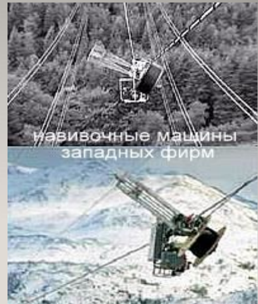
.Реализация навивочных машин.