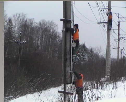
Монтаж самонесущего ВОК.