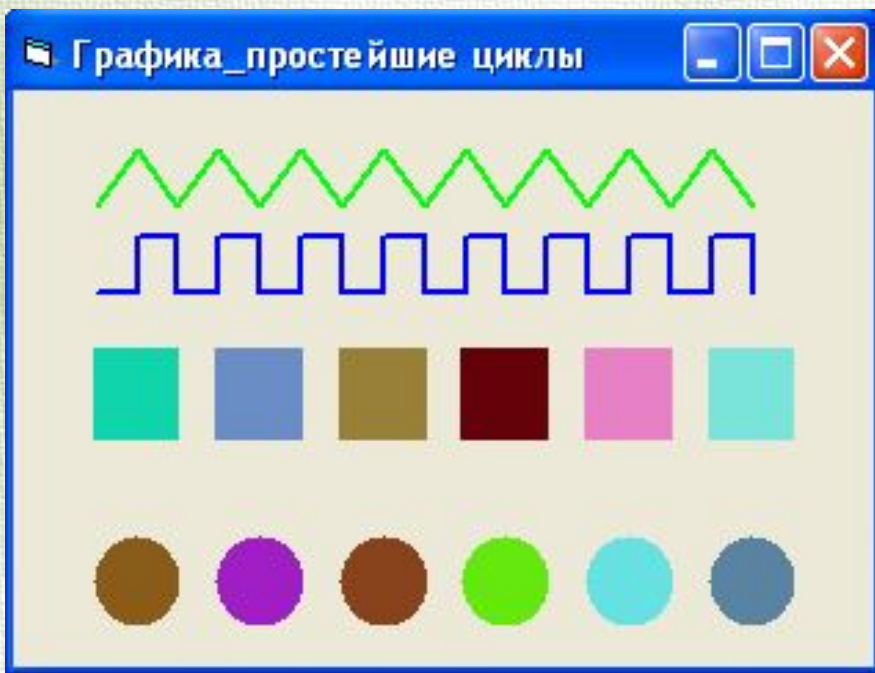
Рис.1. Образец циклических композиций

С помощью цикла можно создать повторяющиеся узоры (рис.1), эффект движения, выполнить расчеты по таблицам и многое другое.