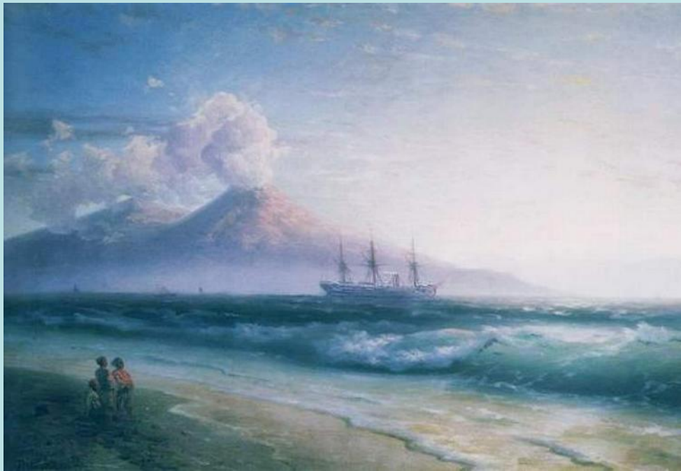
Неаполитанский залив. Раннее утро