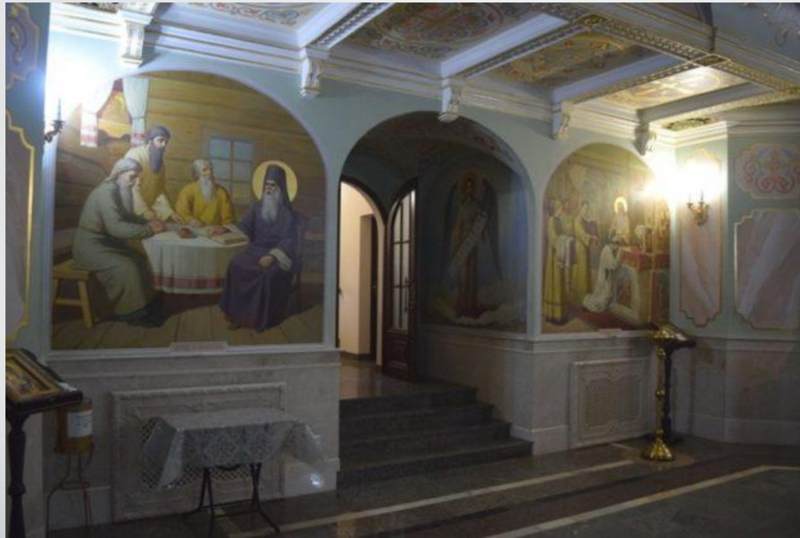
Интерьер нижнего храма Гурия собора Александра Невского