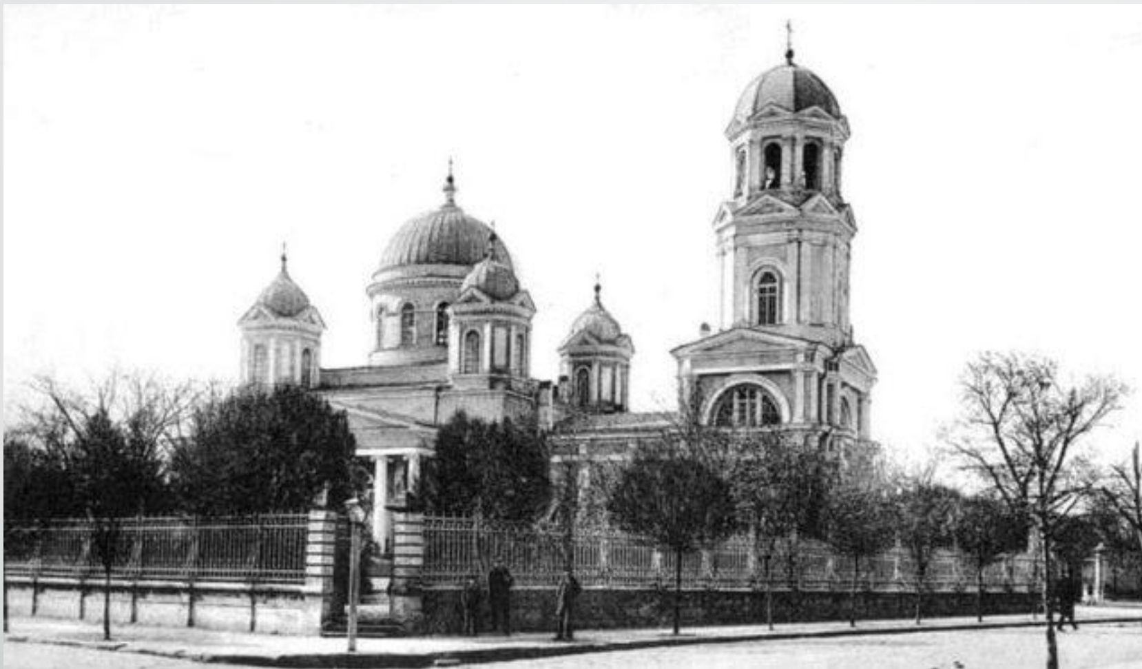
Фото Собора Александра Невского до разрушения