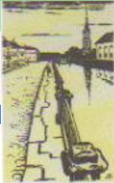
М.Добужинский «Белые ночи», 1922г.