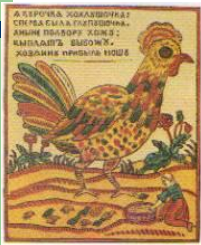
Лубок. Ксилография XVIII в.