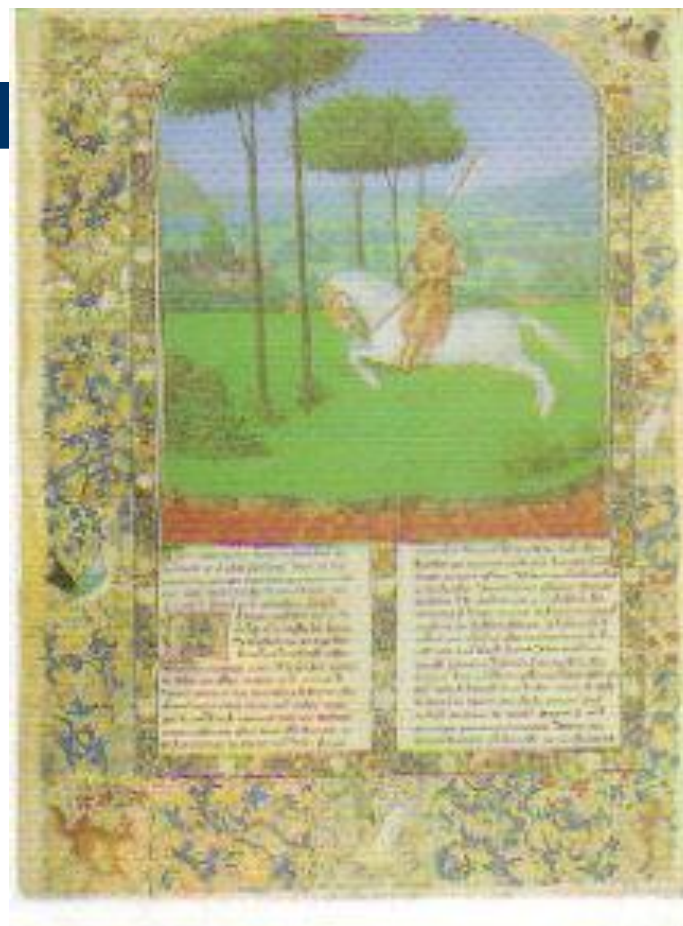
Жан Фуке. Миниатюра 1460- 1476 гг.