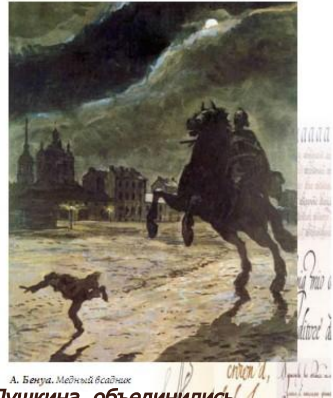
А. Бенуа. Медный всадник

В иллюстрациях А. Бенуа к произведениям А. Пушкина объединились большая эрудиция и безупречный вкус. Рисунки Бенуа к «Пиковой даме», «Медному всаднику», «Капитанской дочке» — явление высокой художественной культуры.