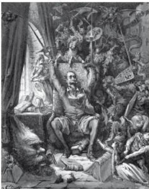
Г. Доре. Дон Кихот

Для многих поколений читателей «Робинзон Крузо» Д. Дефо неотделим от иллюстраций французского графика Гранвиля, а «Дон Кихот» М. Сервантеса, «Приключения барона Мюнхаузена» Р. Распе — от иллюстрации тоже французского графика Г. Доре.