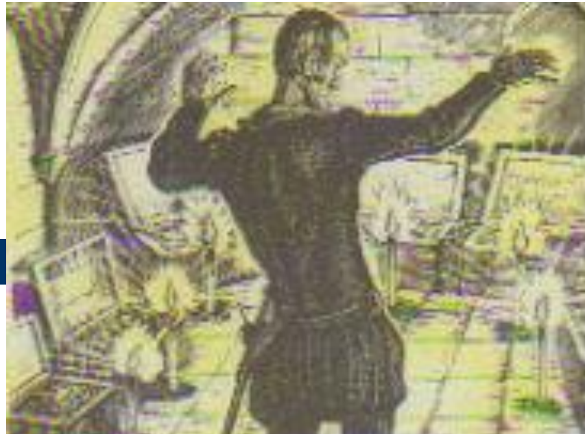
В. Фаворский «Скупой рыцарь», 1962г.