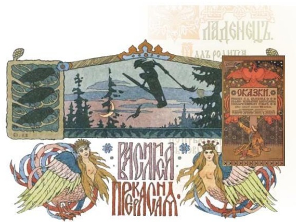
И. Билибин. Василиса прекрасная