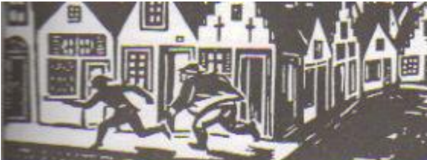
Мазарель. «Тиль Уленшпигель». Тушь, перо