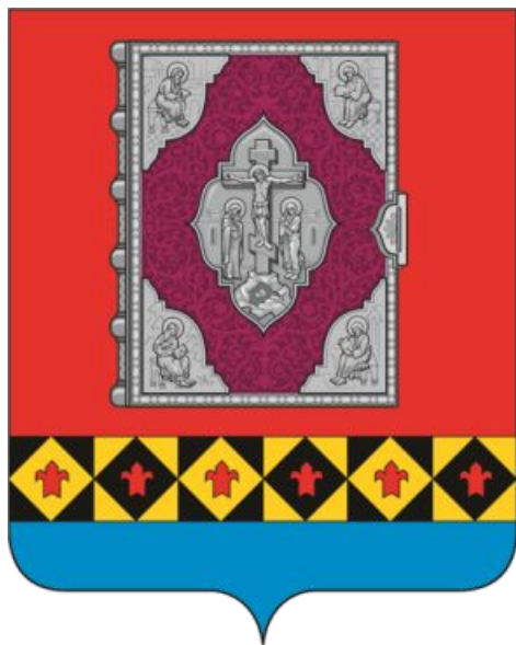
Герб МО МР «Усть- Цилемский»

Познакомить детей выпускной группы детского сада №17 г. Сыктывкара с Усть-Цилемским нарядом, с особенностями его внешнего вида, через создание аппликации из бумаги.