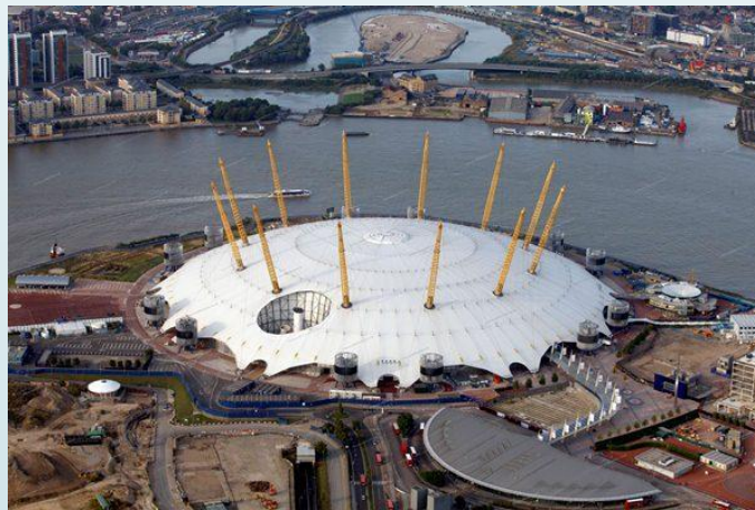
О2 Арена 2007, Лондон