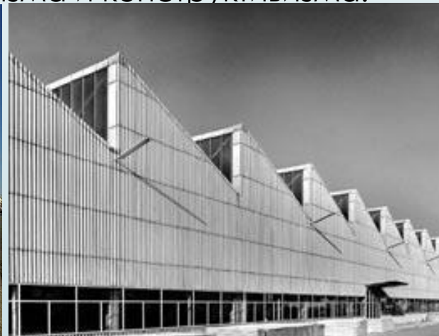
Eternit-Werk, Leimen, 1954