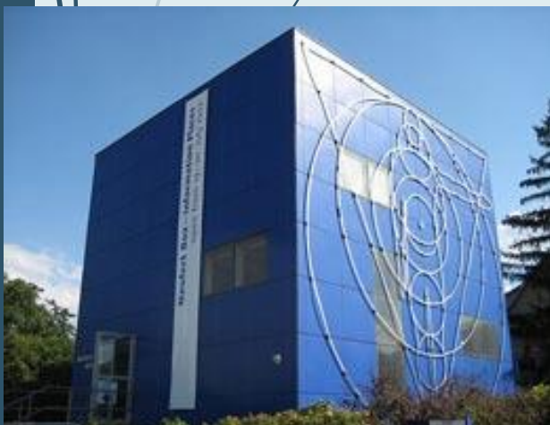
Atelierhaus (Neufert Box), Weimar-Gelmeroda, 1938