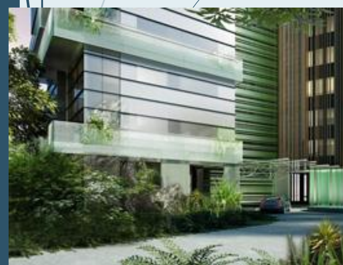
Residential tower on Orchard Blvd., Singapore, 2008