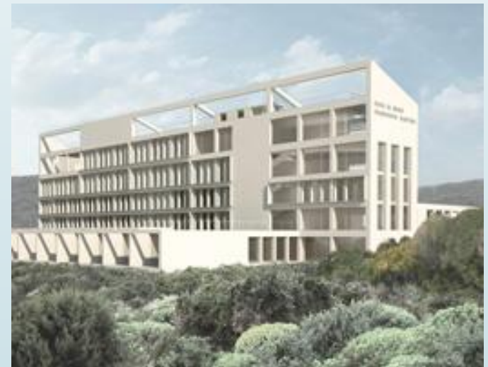
Hotel in the former Sartori summer colony in Funtanazza, Sardinia (Italy), 2008