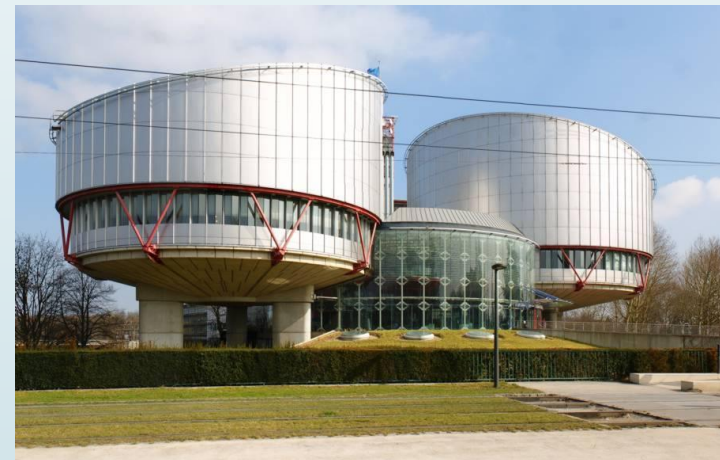
Европейский суд по правам человека, 1959, Страсбург