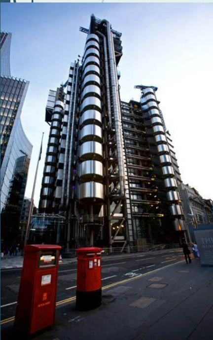
Штаб-квартира компании «Ллойд» 1991, Лондон