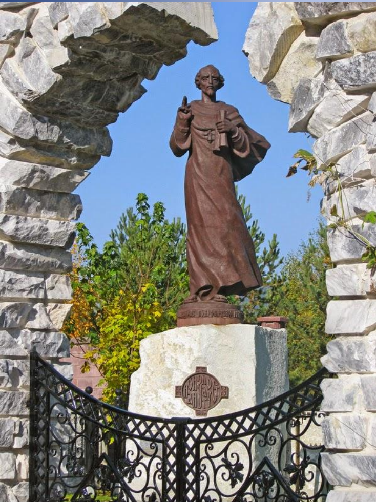
Памятник святителю Иоанну Златоусту. 2007 г.

Златоуст был основан в 1754 г. одновременно с железоделательным заводом и назван в честь святого Иоанна Златоуста. Город расположен на границе Европы и Азии на берегах реки Ай и ее притоков. Город со всех сторон окружен горами Южного Урала.