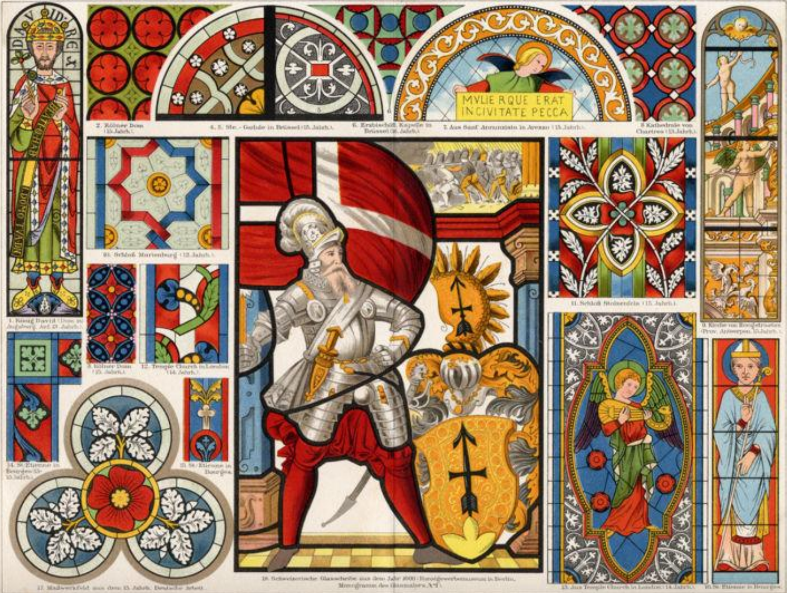
18. Schwedische Glasmalerei aus dem Jahr 1800: Hingewerbenutzung in Berlin, Merzgraben des Glasmalers A. M.