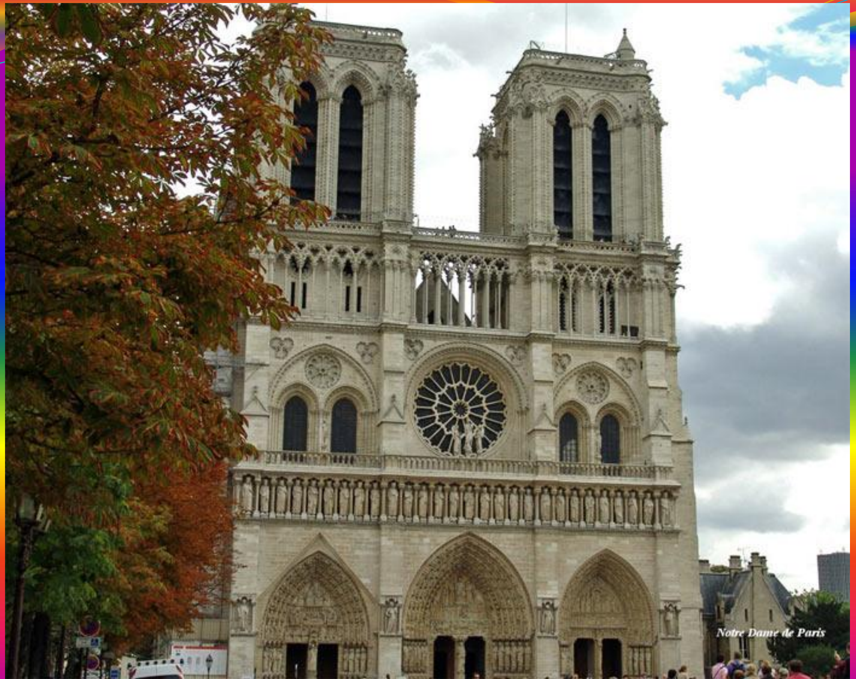
Notre Dame de Paris