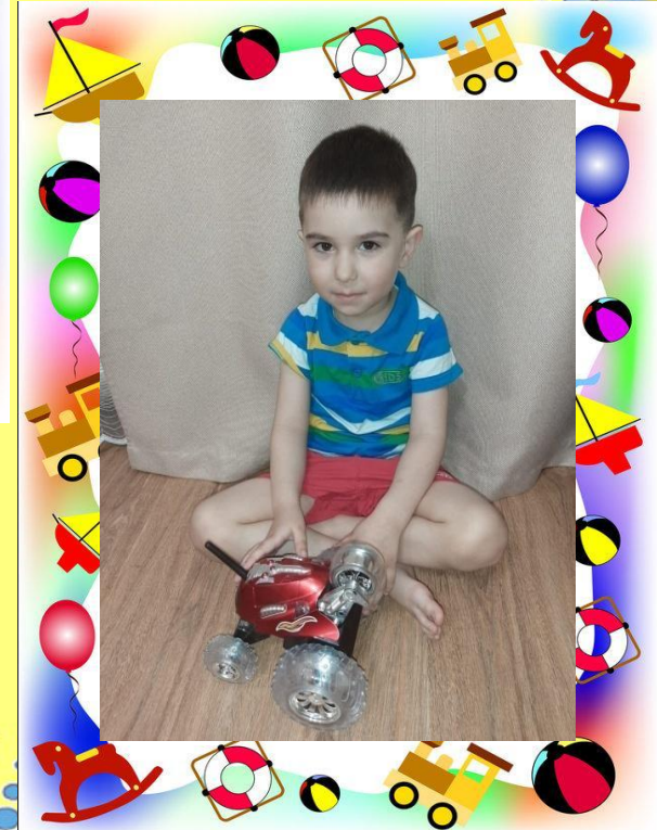
Моя очень любимая машина