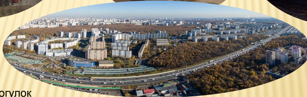
Парк для прогулок