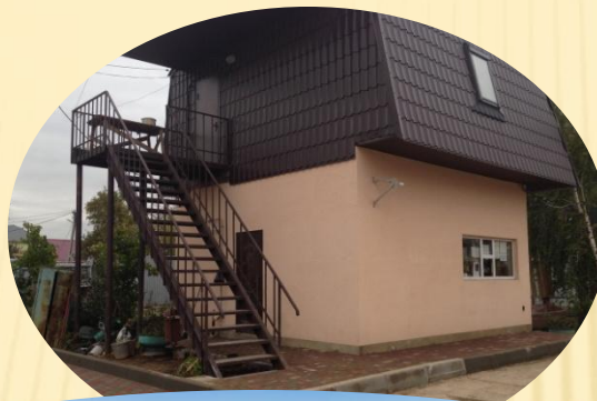
КПП на въезде