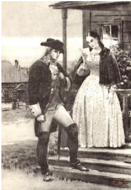
Пётр Гринев и Маша Миронова