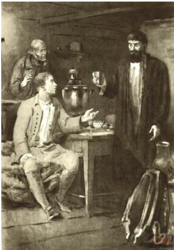
Пётр Гринев и Емельян Пугачев