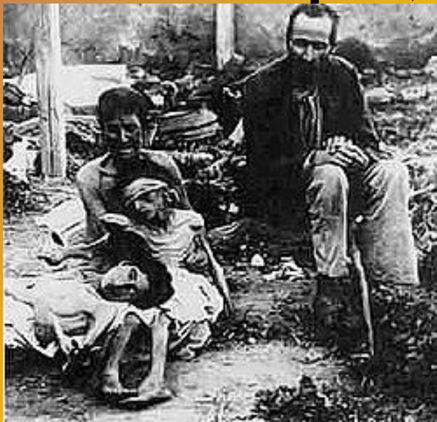
Больные тифом крестьяне