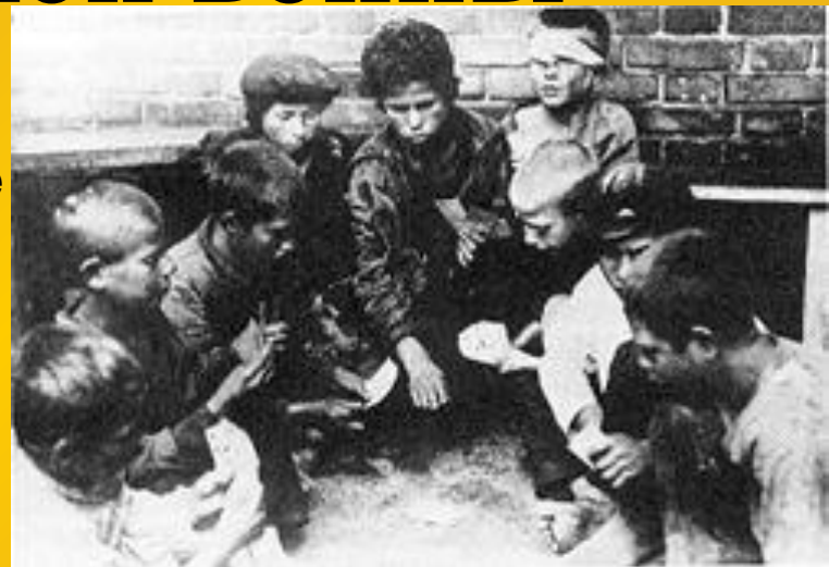
Бездомные дети (беспризорники)