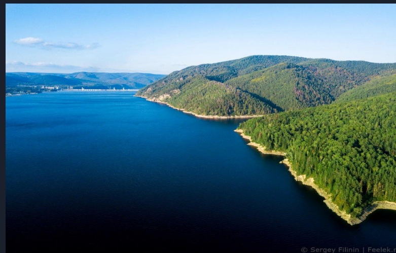
КРАСНОЯРСКОЕ ВОДОХРАНИЛИЩЕ (площадь 2000 км 2 )