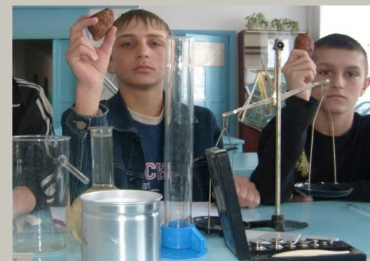
На уроке физики