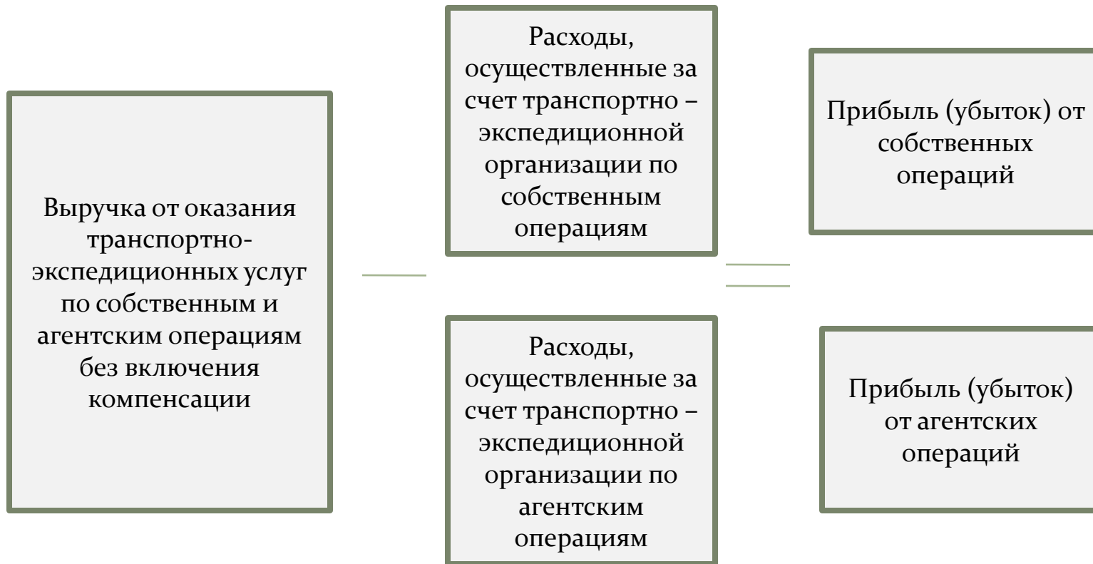
Рис. 1. Формирование прибыли от транспортно – экспедиционных услуг