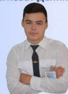
Министерство внутренних дел Садыков Ильшат