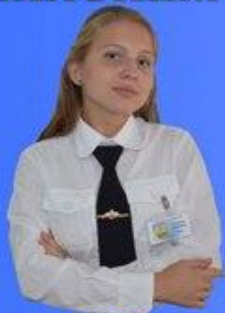
Министерство культуры Петрова Эвелина