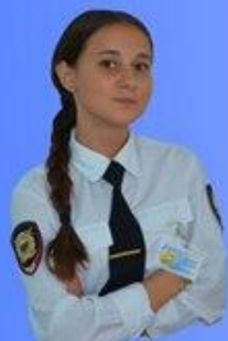
Премьер-министр Липина Полина