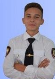
Вице-президент Исхаков Булат