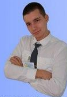
Министерство здравоохранения Насыров Ринат