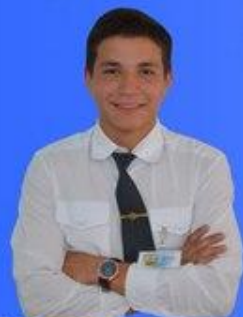
Министерство спорта Тагиров Ильшат