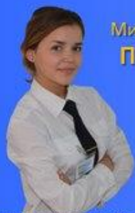
Министерство экономики Лотфуллина Айгуль