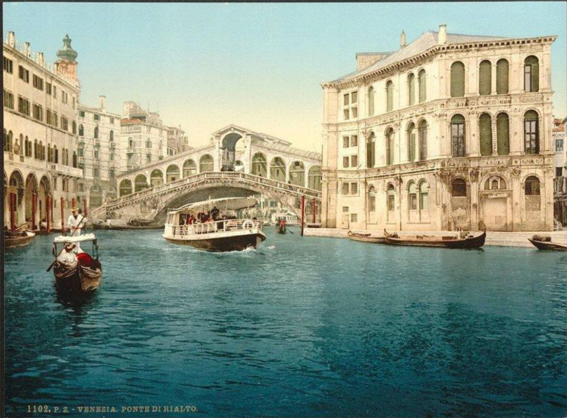
1102. P. Z. - VENEZIA. PONTE DI RIALTO.