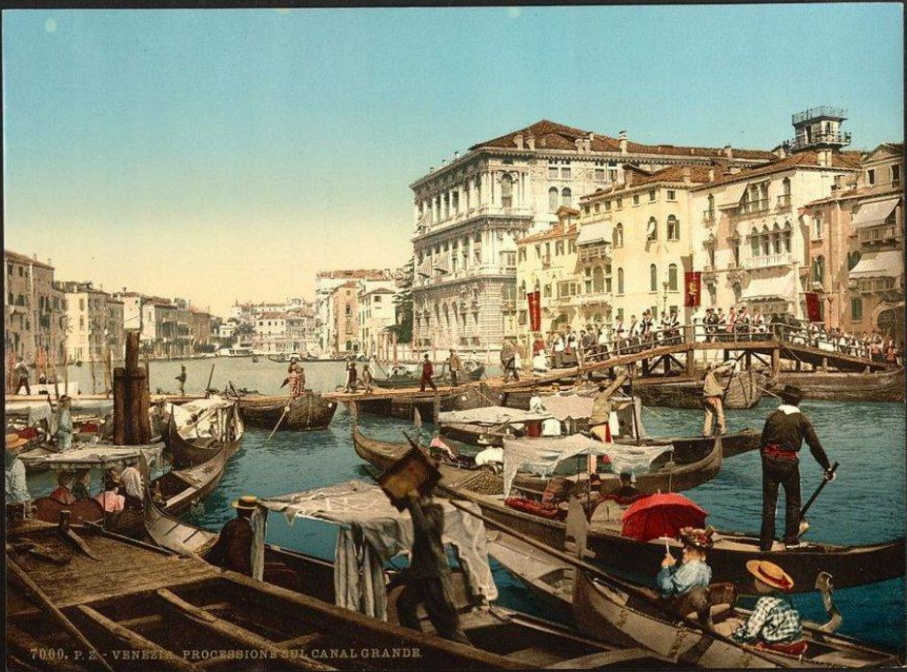
7000. P. Z. - VENEZIA. PROCESSIONE SUL CANAL GRANDE.