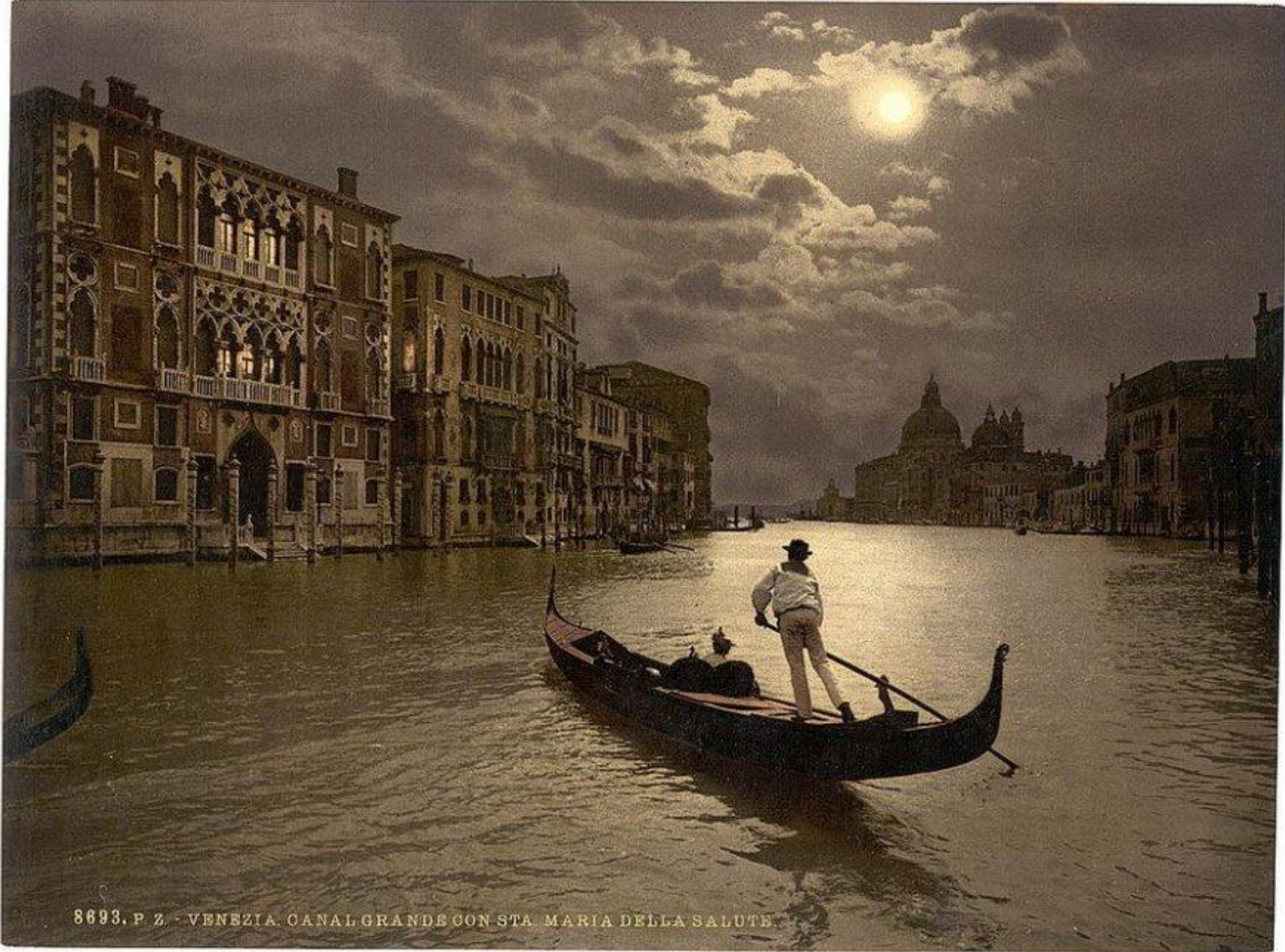
8693. P. Z. - VENEZIA. CANAL GRANDE CON STA. MARIA DELLA SALUTE.