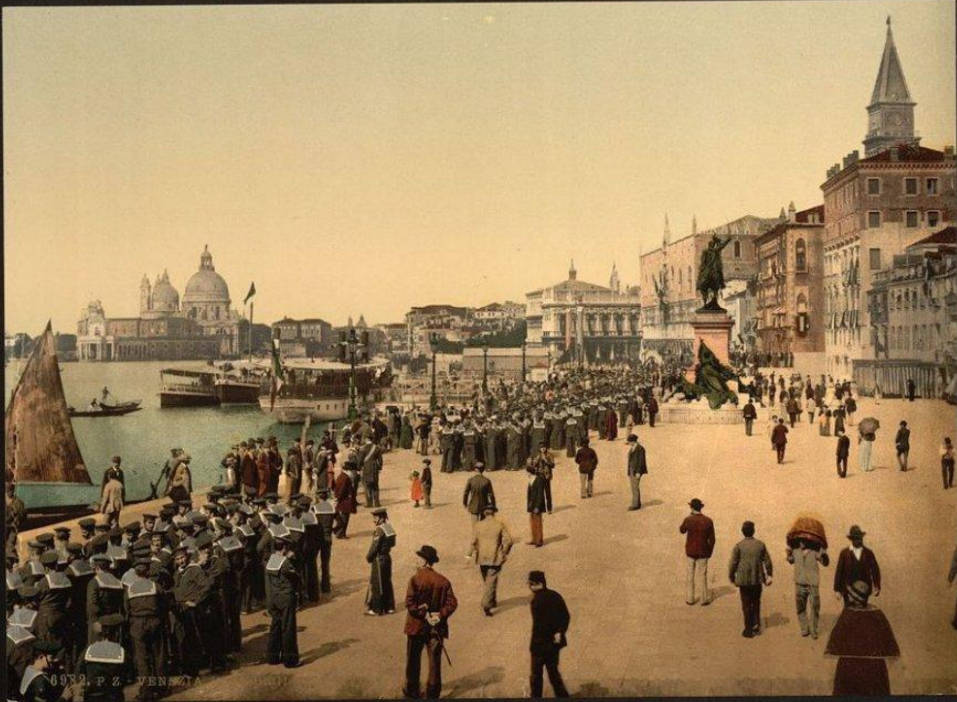
6932. P. Z. - VENEZIA