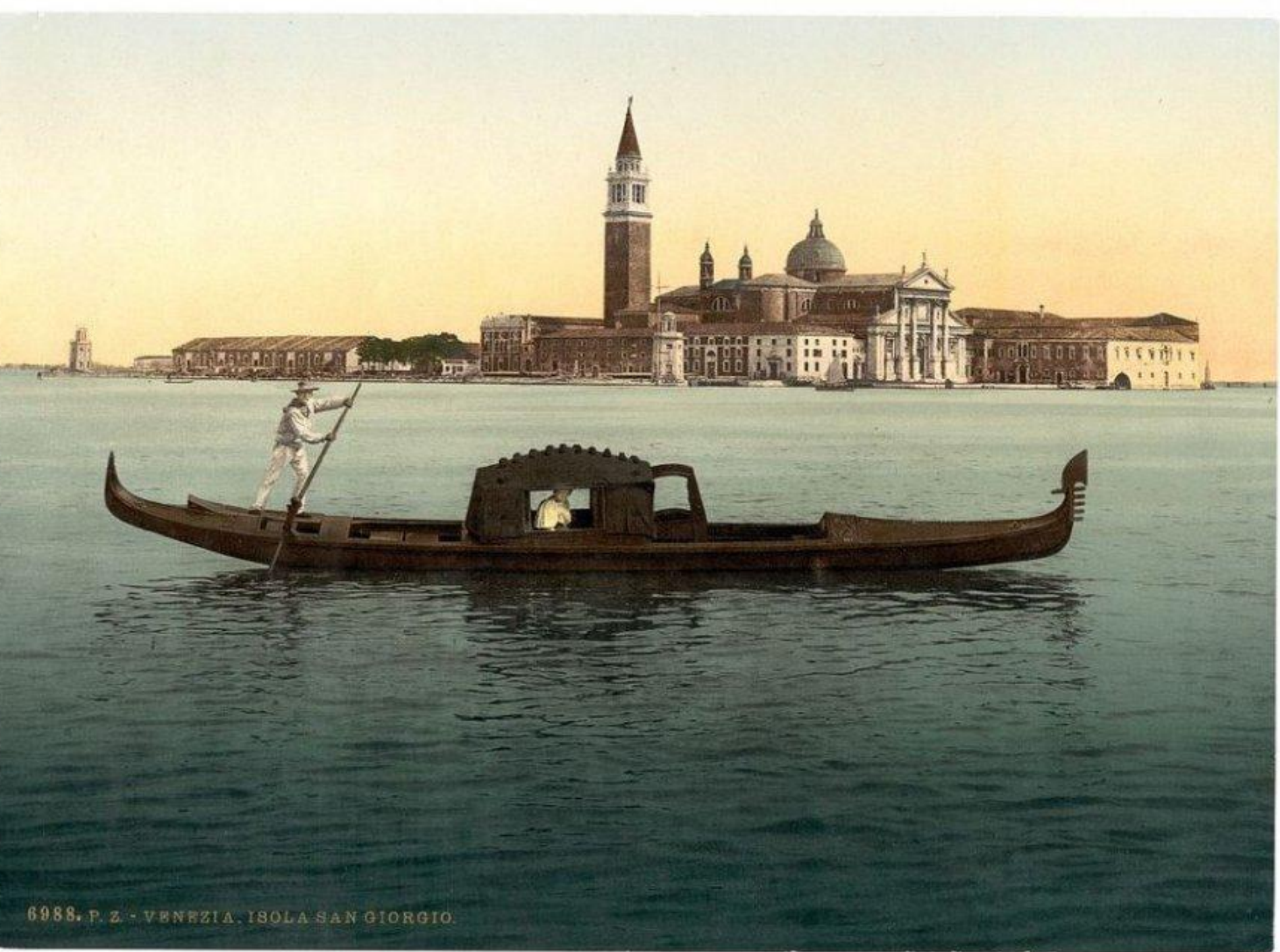
6988. P. Z. - VENEZIA. ISOLA SAN GIORGIO.