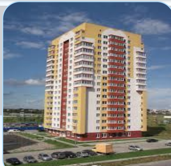
Многоквартирный жилой дом