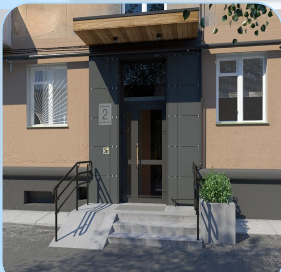
Подъезд жилого дома