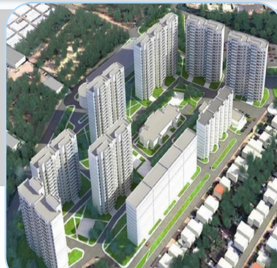
Группа жилых домов