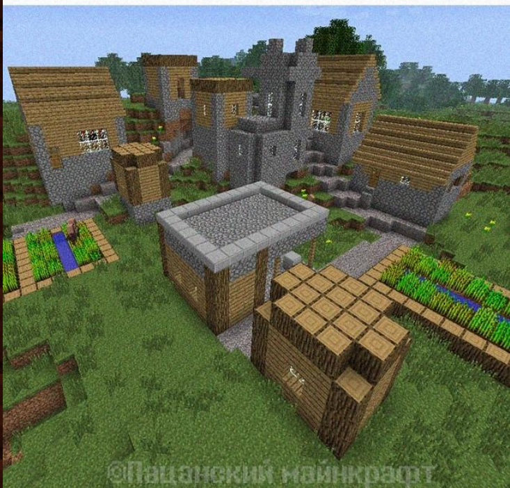
Район где потерялось детство.

Компьютерная инди-игра в жанре песочницы, разработанная шведским программистом Маркусом Перссоном и выпущенная его компанией Mojang AB. Перссон опубликовал начальную версию игры в 2009 году в конце 2011 года была выпущена стабильная версия для ПК Microsoft Windows, распространявшаяся через официальный сайт. В последующие годы Minecraft была портирована на Linux и macOS для персональных компьютеров; на Android, iOS и Windows Phone для мобильных устройств; на игровые приставки PlayStation 4, Vita, VR, Xbox One, Nintendo 3DS, Switch и Wii U