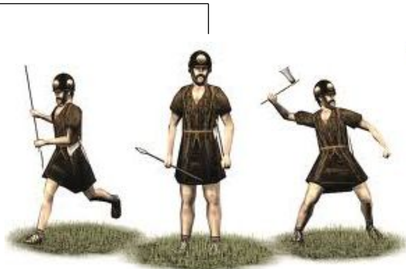
heloci – „niewolnicy”, najlicniejsza grupa, własność państwowa