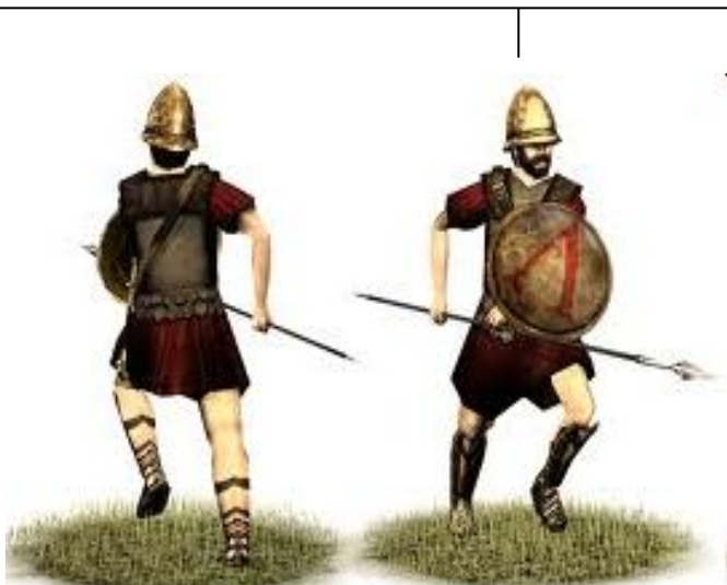
periojkowie – ludność rolna zamieszkująca wybrzeża i góry