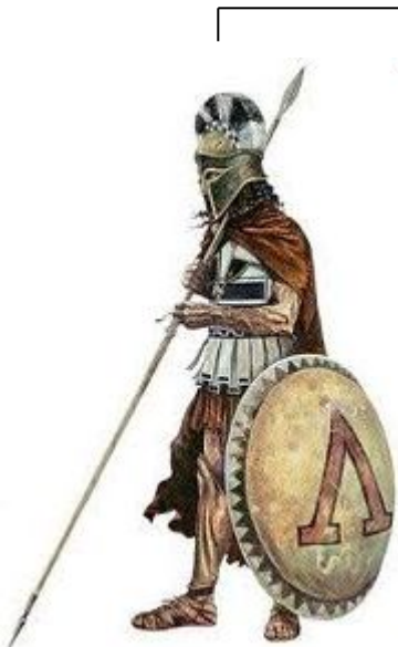
spartiaci – pełnoprawni obywatele