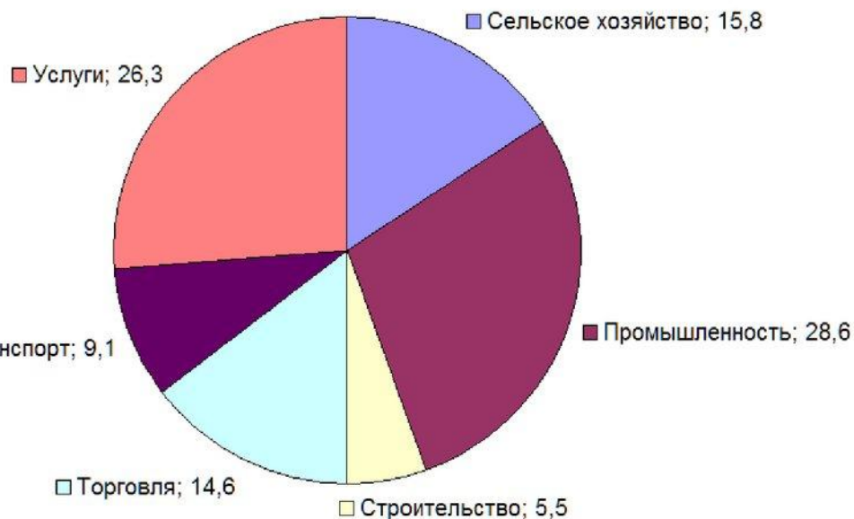
Структура экономики Африки, %, 2013

Африка занимает последнее место по уровню индустриализации, транспортной обеспеченности, развитию здравоохранения и науки, урожайности сельскохозяйственных культур и продуктивности животноводства. По доли в мировом ВВП (4,5%) Африка опережает только малонаселенную Австралию. Отраслями специализации хозяйства Африки являются лишь горнодобывающая промышленность и тропическое и субтропическое земледелие.