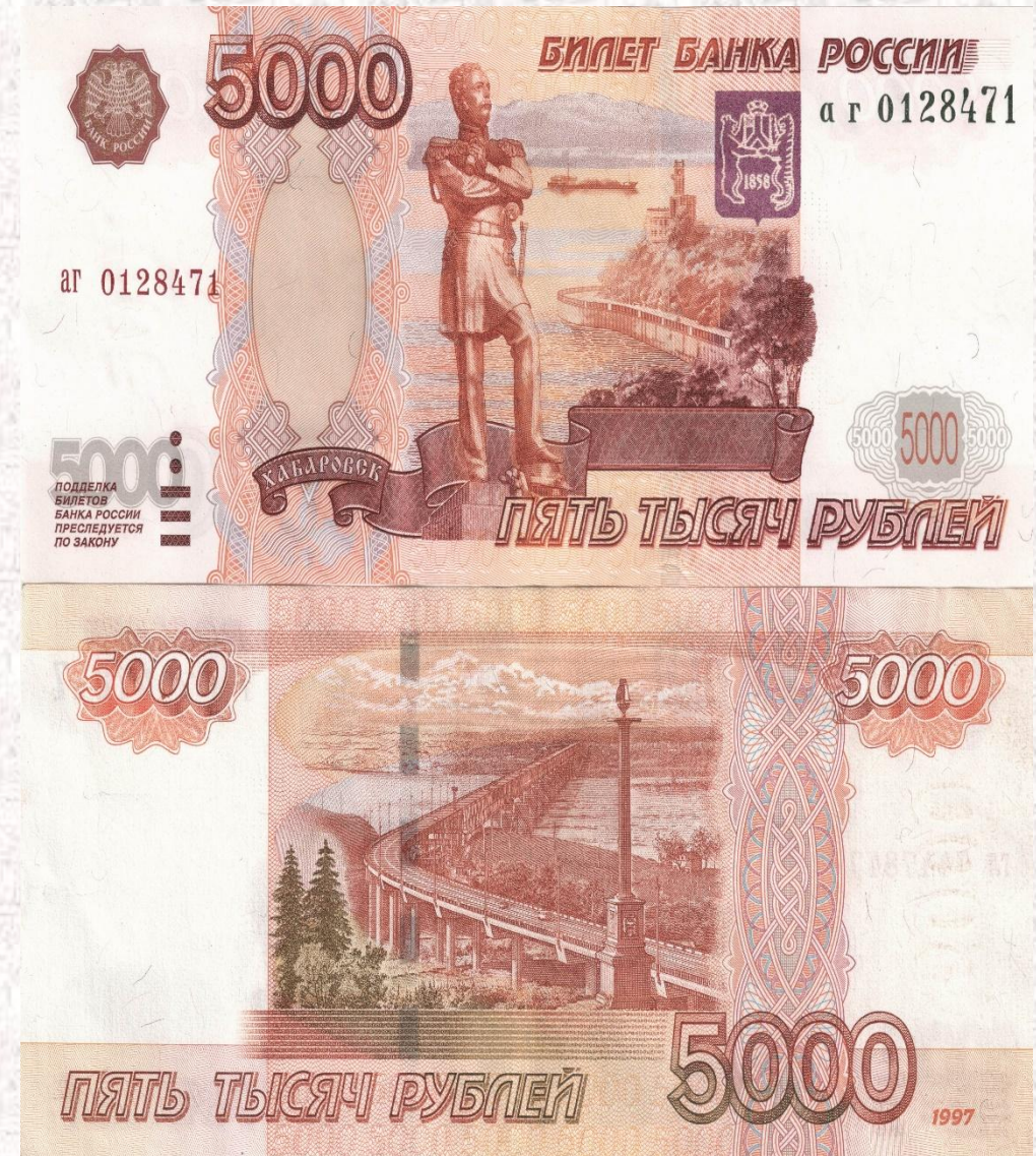
Банкнота достоинством 5000 рублей

Преобладающий цвет банкноты - красно-коричневый. Преобладающий цвет банкноты - красно-коричневый. Банкнота обладает несколькими машиночитаемыми защитными признаками. машиночитаемыми защитными признаками.