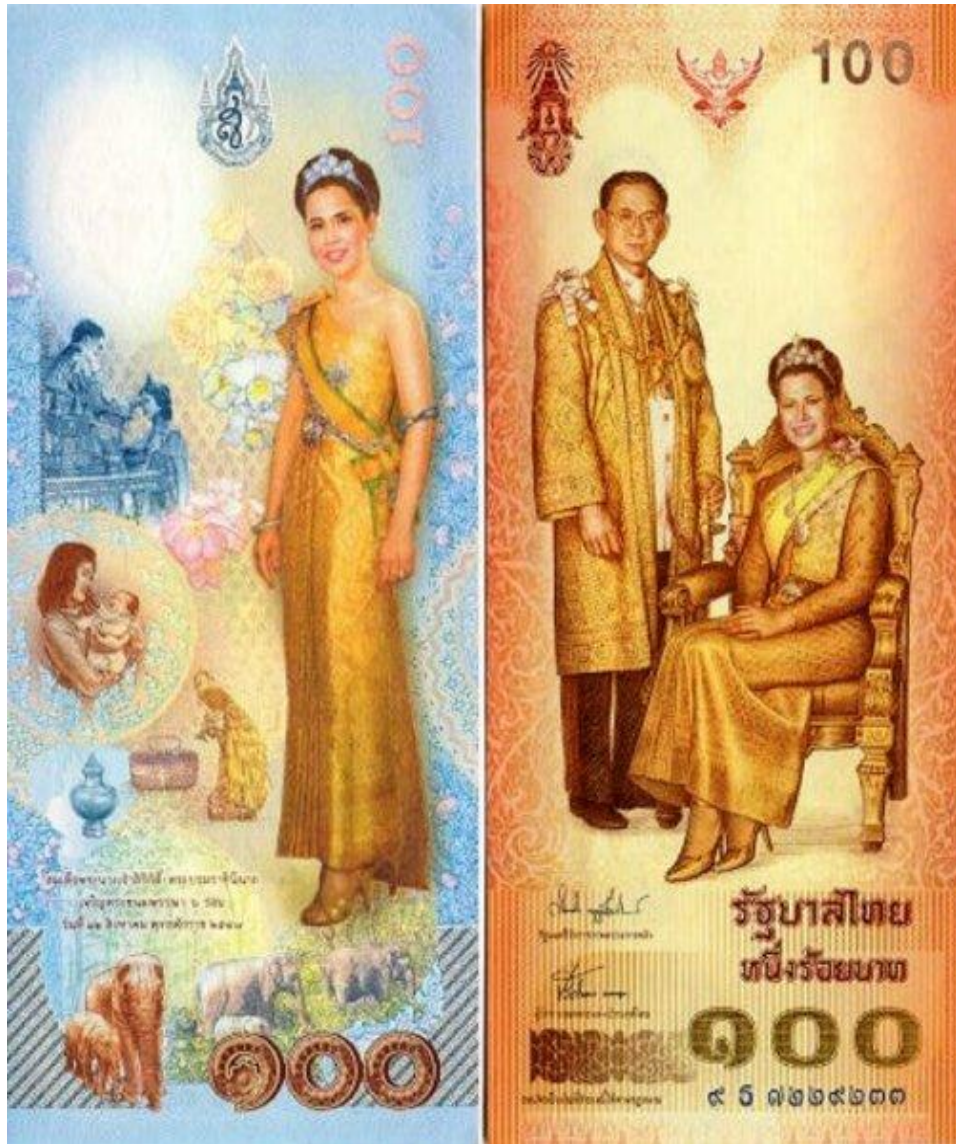
Памятная банкнота в 100 тайских батов

В 2004 году Тайская Королева отпраздновала свой семьдесят второй день рождения и к этому дню национальный банк выпустил памятную банкноту, на которой изображалась она рядом с мужем, королём Рамой IX. Обратная сторона охватывает важные сцены из жизни королевы.