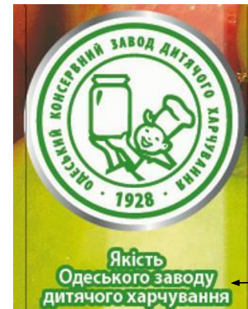
敖德萨婴儿罐头食品厂

少许果肉沉淀, 饮用前请摇匀 全球合作热线 (+38) 0800501915 净含量: 约1升