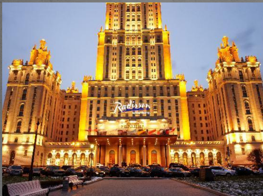
Radisson Royal Hotel