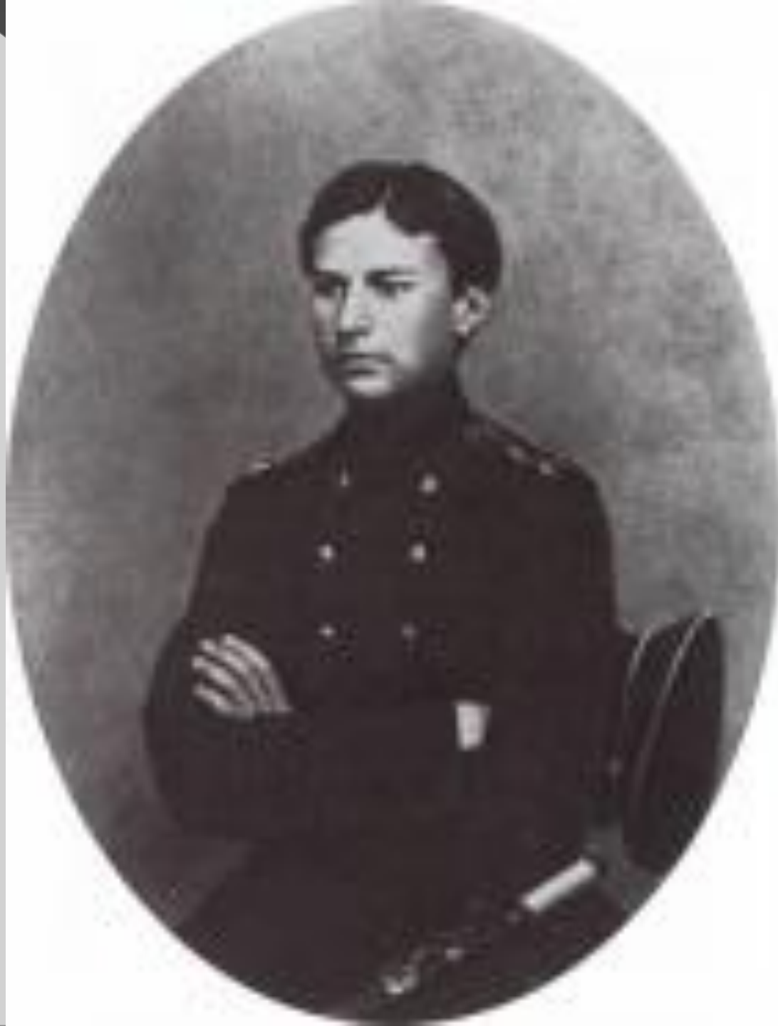
В.В. Верещагин в период окончания Морского кадетского корпуса