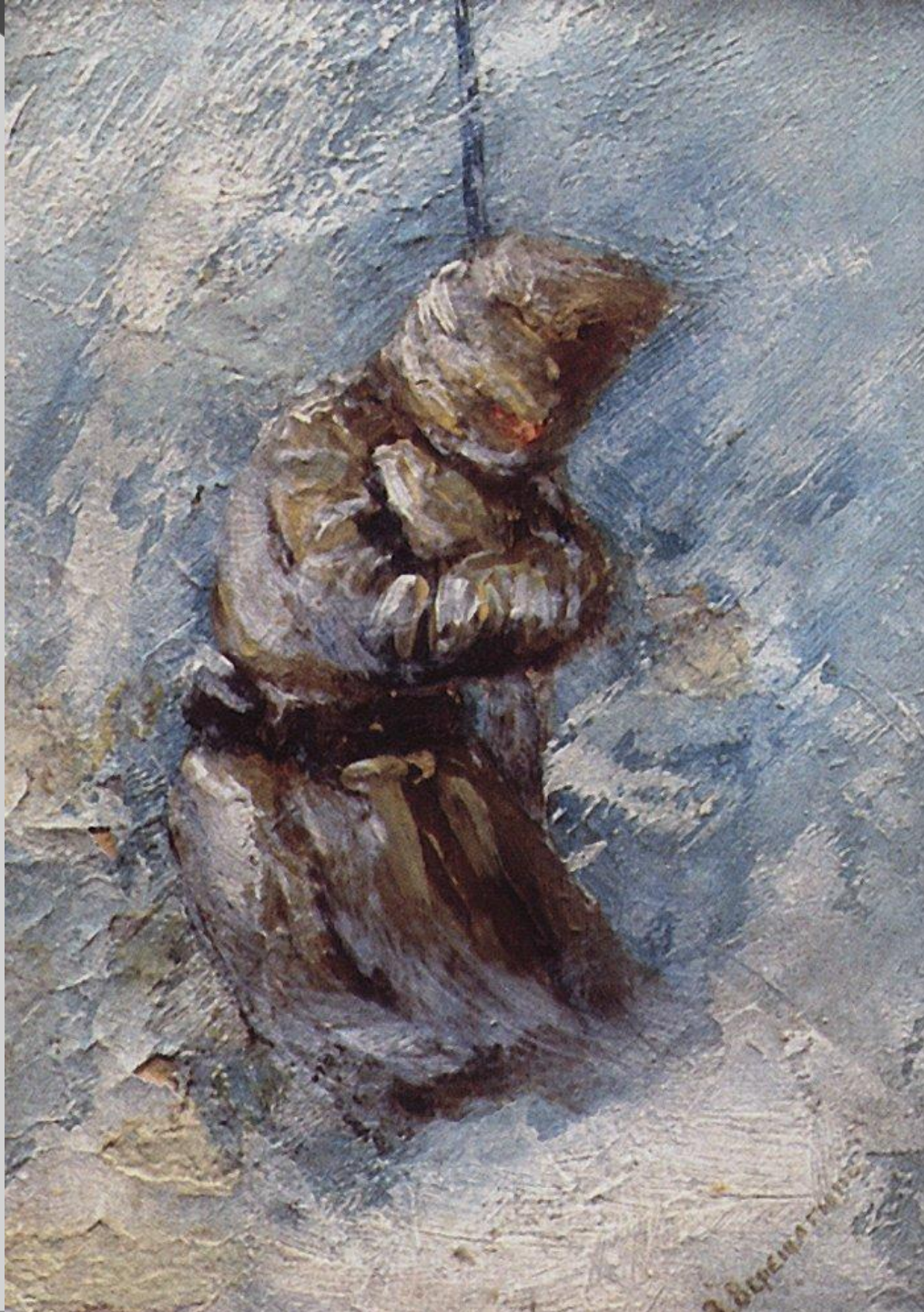
В.В. Верещагин. На Шипке всё спокойно! 1878 - 1879.