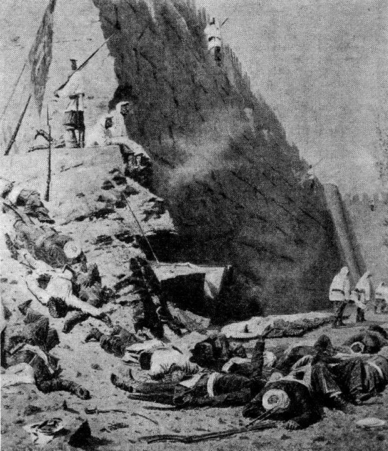
В.В. Верещагин. Вошли. 1871.