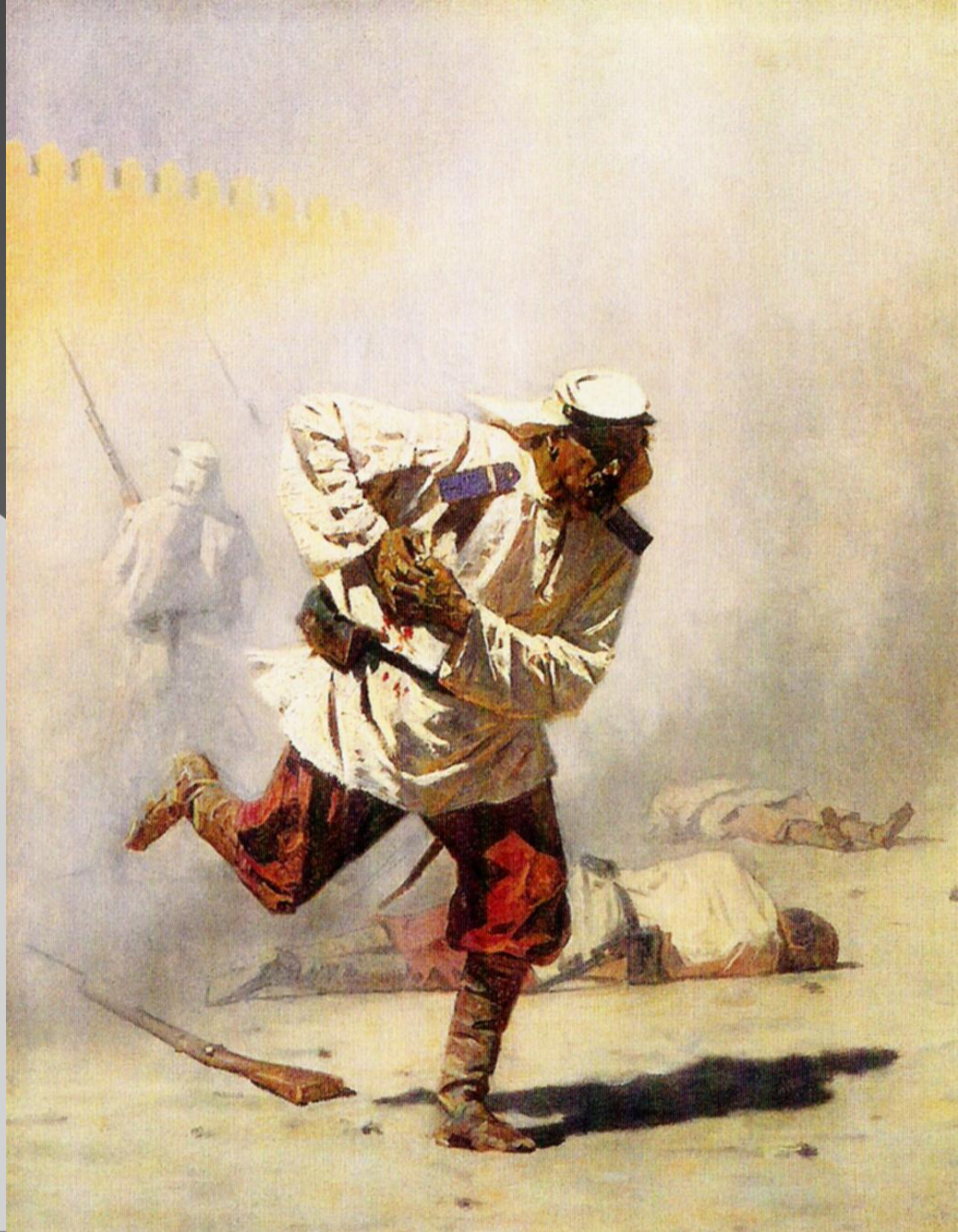
В.В. Верещагин. Смертельно раненый. 1871- 1872.