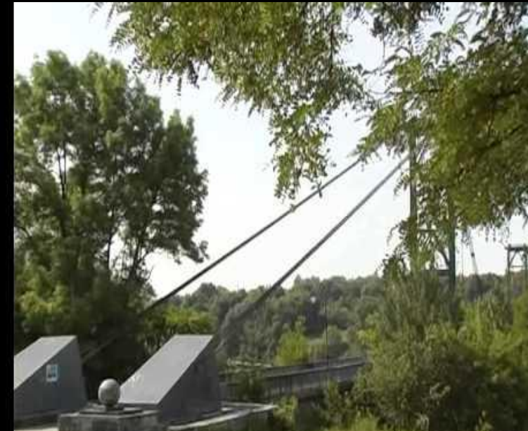
Парк ім. Юрія Гагаріна