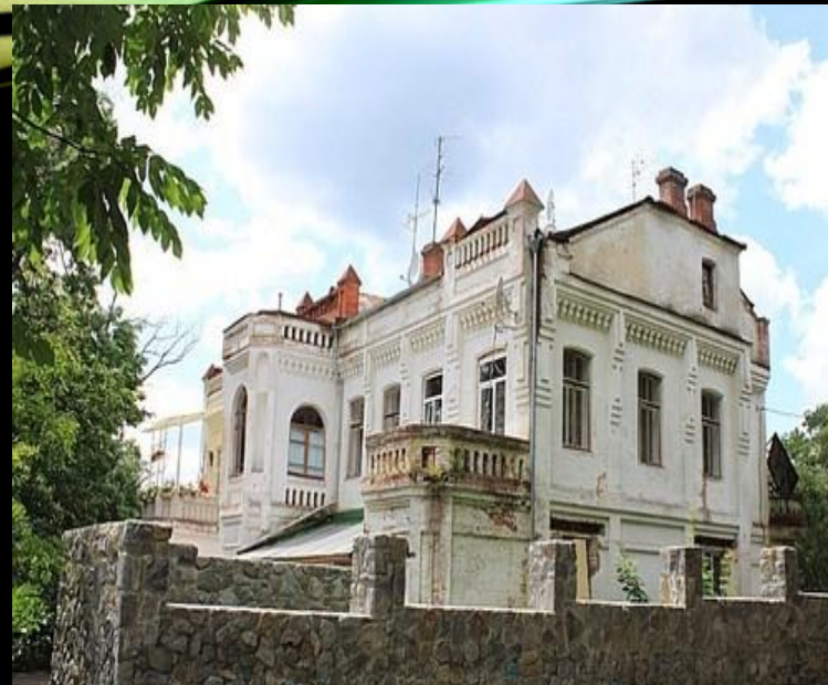
Дім Максиміліана де Шодуара