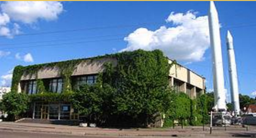
Музей космонавтики імені С. П. Корольова.