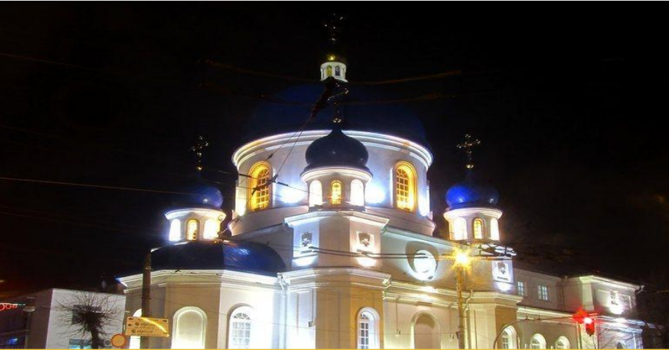
Свято-Михайлівський кафедральний собор