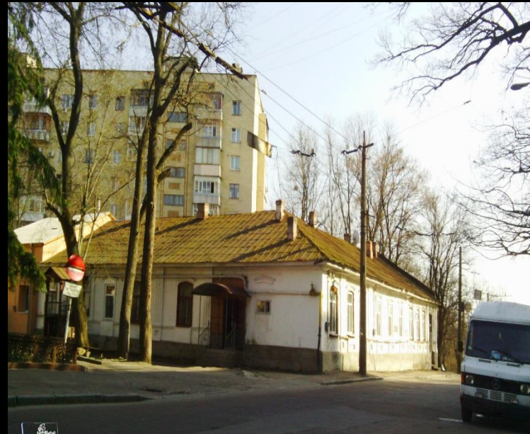
Дім де жив Юзеф Крашевський