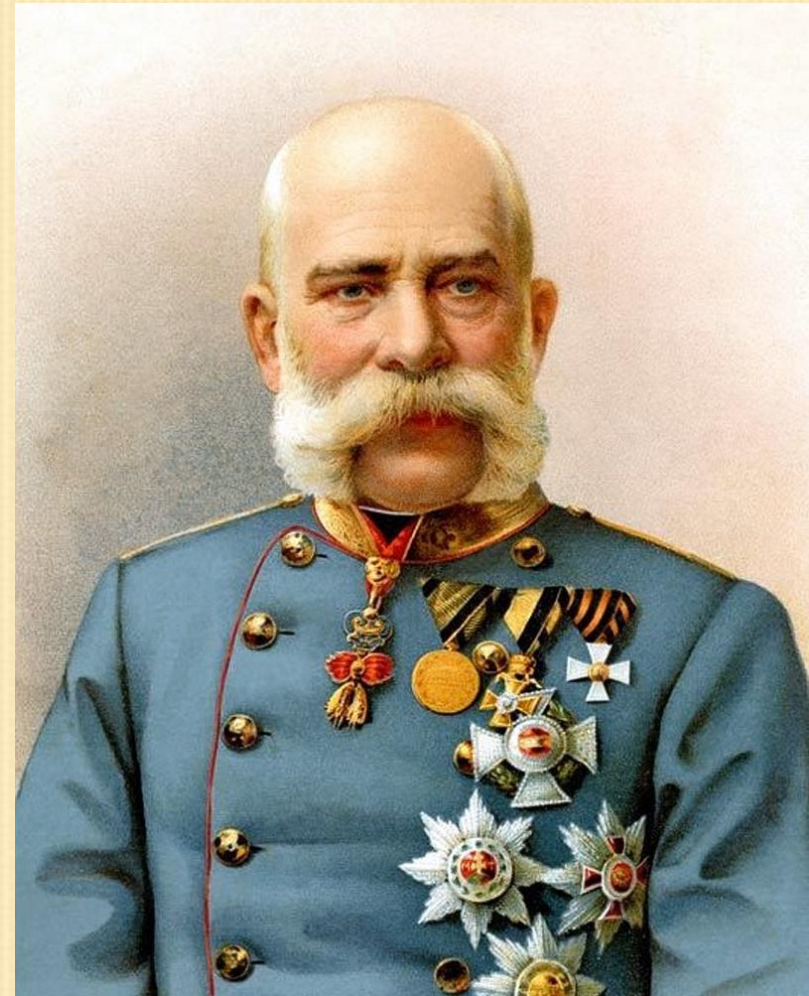
Франц Иосиф – император Австро-Венгрии