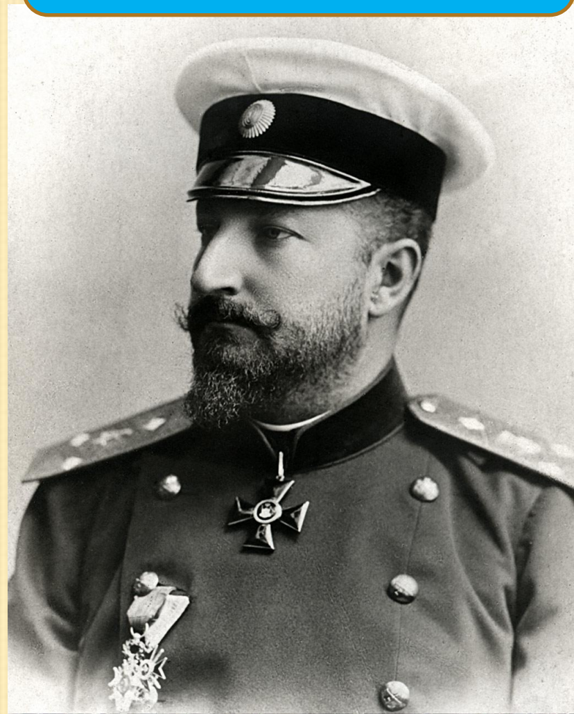
Фердинанд Первый – Болгарский царь