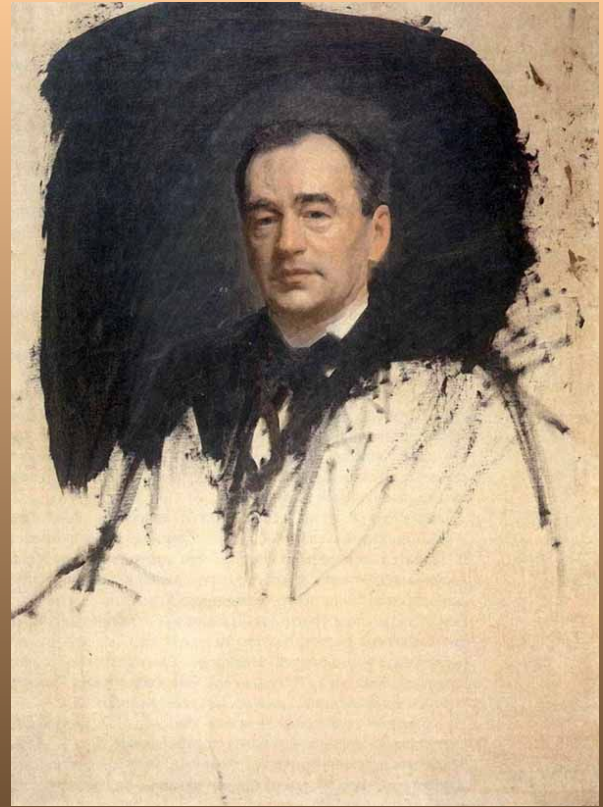
И.Крамской. “Незаконченный портрет доктора К.А.Раухфуса”. 1887 г.

Крамскому было сорок девять лет, когда в 1887 г. он скончался в Петербурге из-за болезни сердца. до последних минут жизни работая над портретом доктора Раухфуса. Раухфус попытался оказать ему помощь, но было уже поздно.