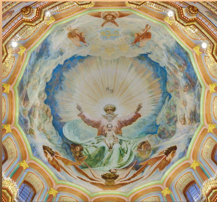
А.Т.Марков. “Купол Храма Христа Спасителя”. 1865 г.

В 1863—1868 годах он преподавал в Рисовальной школе Общества поощрения художников. В 1869 году Крамской получил звание академика.