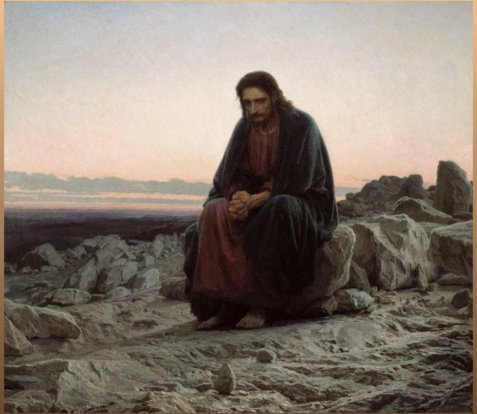
И.Крамской. «Христос в пустыне». 1872 г.

Одна из известнейших работ Крамского - «Христос в пустыне» (1872).