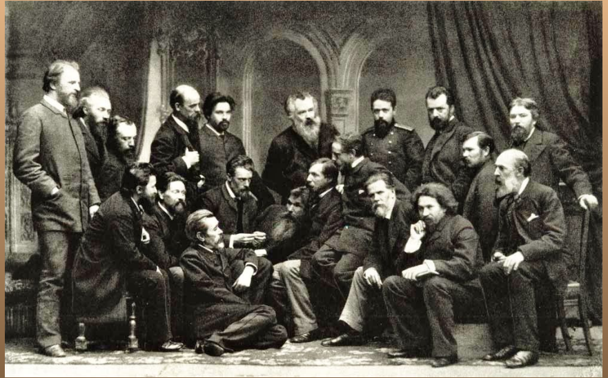
Группа членов Товарищества передвижных художественных выставок (1886 год)

В 1870 году образовалось «Товарищество передвижных художественных выставок», одним из основных организаторов и идеологов которого был Крамской. Под влиянием идей русских демократов-революционеров Крамской отстаивал взгляд о высокой общественной роли художника, принципов реализма, моральной сущности и национальности искусства.