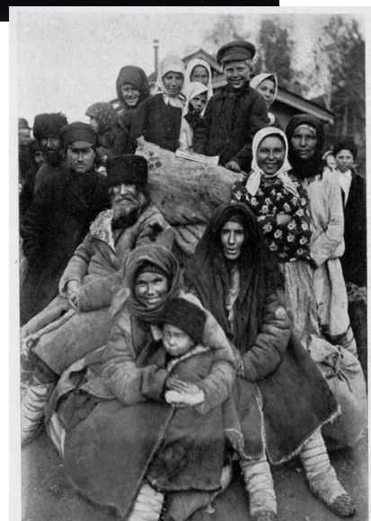
Группа переселенцев Пензенской губернии. Рис. 48